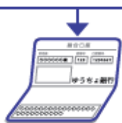
通帳 (ゆうちょ銀行の場合) ※ゆうちょ銀行の場合は通帳表紙のページ(全面)のコピーを同封してください。