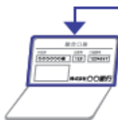
通帳 (ゆうちょ銀行以外の場合)

口座を確認できる通帳等のコピー(A4判)を必ず同封してください。 ※支給対象者名義の口座に限ります。