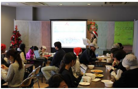
【約100名の方々にお越しいただきました!】