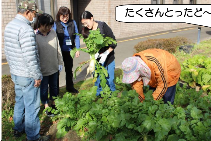
たくさんとったど〜!

今回の活動では12月10日（土）に開催予定の冬のイベントについて話し合うことと、当日に向けての漬物づくりに取り組みました。メンバー全員で、イベント参加者に提供する白菜料理やイベントの内容を考えました。話し合いの結果、今年は、「白菜たっぷり鍋でクリスマス会」と題して開催することになりました。会議後は、1週間後の本番食べる白菜づけとキムチ漬けを作りました。本番でおいしく食べられるといいなと思います。