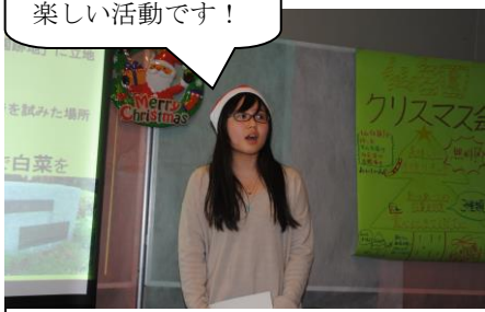
【仙白園について発表】