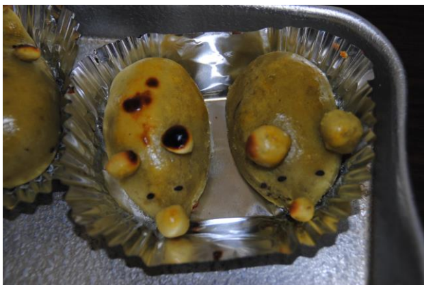
【かわいいポテトもありました！】