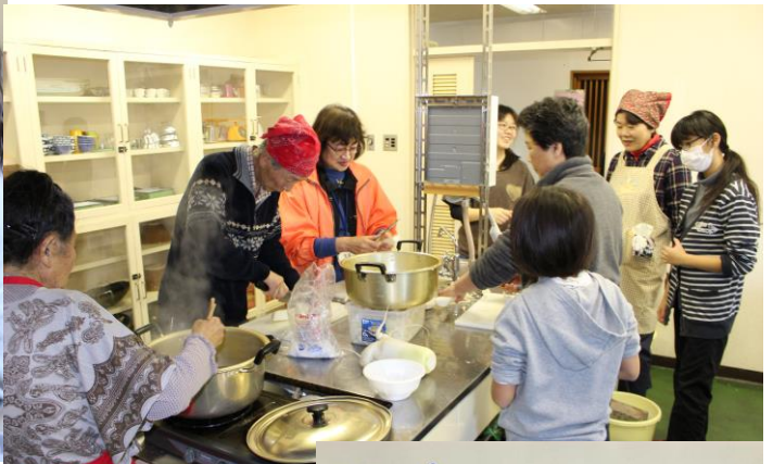
おいしい白菜漬けを作るぞ!