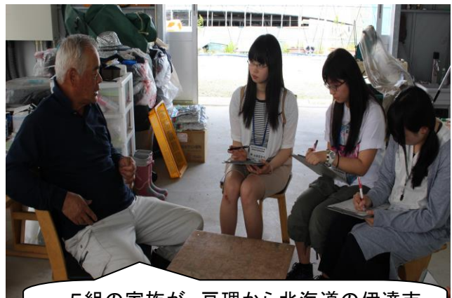
5組の家族が、亘理から北海道の伊達市に移り住んでいちご作りをしているんだ。