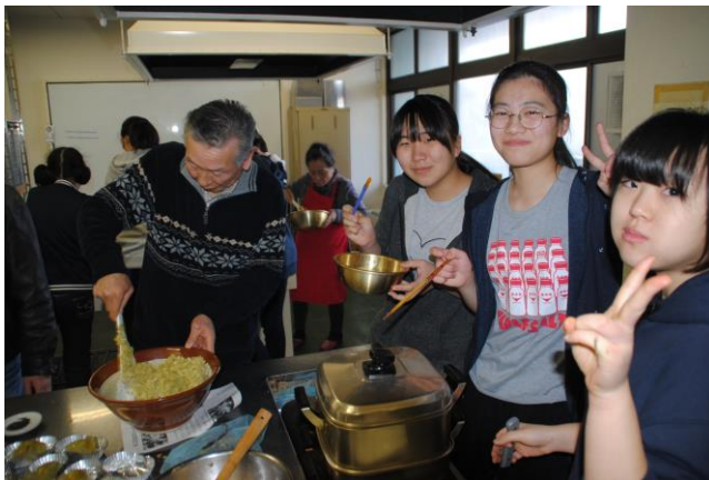
【地域の人と一緒に！】

さすがジュニアリーダーね。 そのまま仙白園に入ってもいいのよ！ わたしたちがやさしく教えてあげるよ！