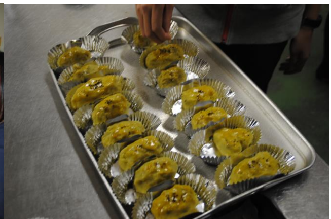
【お菓子屋さんで売っているお菓子みたい！】