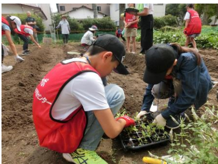
【白菜の苗を選んでいきます】