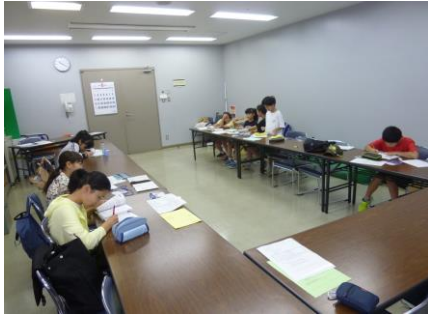
【6月22日の活動の様子】

6月22日（日）と7月21日（日）は、NPO法人あかねグループさんが高齢の方に届ける宅配弁当にそえる手紙書きをしました。学校行事の話題や暑い季節に向かう時期に合わせて熱中症に気をつけてくださいなど受け取る方々のことを思い浮かべながら手紙を書きました。6月の活動には8人のメンバーが、7月の活動には5人のメンバーが参加しました。楽しく交流しながら、合計190通の手紙に1枚1枚色鉛筆などでていねいに色塗りを仕上げました。