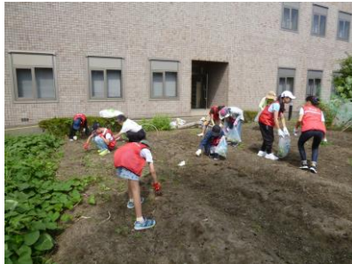
【初めに草取りをしました】