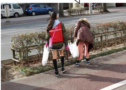
【植え込みも注意して見ました】