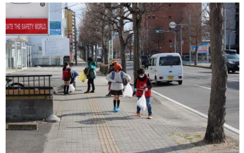
【歩きながら楽しく活動中です】