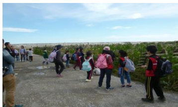
【植えた苗の説明を聞いています】