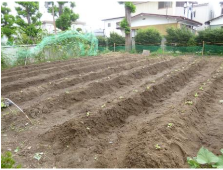
【苗植え終了後の畑です】