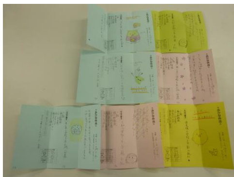
【完成した手紙です】