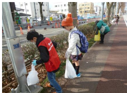
【拾い残しがいないか確認中です】