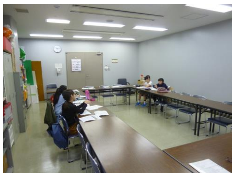
【楽しく話しながら活動しています】

1月25日(土)は、NPO法人あかねグループさんが高齢の方に届ける宅配弁当にそえる手紙書きをしました。参加予定だったメンバーのうち3名がインフルエンザのため欠席となってしまい4名での活動になりましたが、暖冬にちなんだ話題や流行しているインフルエンザに気をつけてくださいなど受け取る方々のことを思い浮かべながら手紙を書きました。今回参加したメンバーは全員5年生ということでいろいろなお話をしながら楽しく活動していました。会話の中では、1月に行われた成果報告会の時に出された「チャボ!ダンス」が話題になって、チャボの歌と合わせてみんなで作ってみたいと大いに盛り上がっていました。みんなでできるといいですね。今回は合計190通の手紙に1枚1枚色鉛筆などでていねいに色塗りを仕上げました。