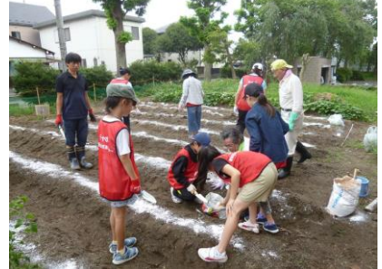
【肥料をまいたところでは】