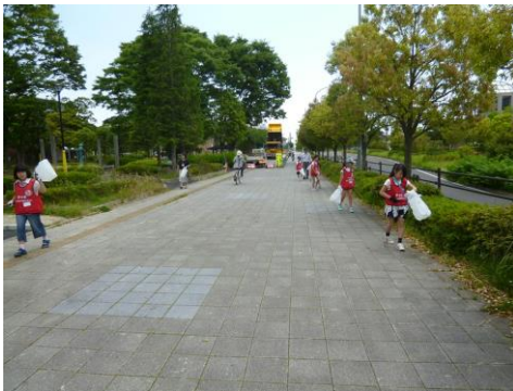
【ゴミ拾い活動スタートです】

今回は保護者の方の参加はありませんでしたが、説明会の後に参加した6名（全員5年生）のメンバーと文化センター周辺の「ゴミ拾い」をしました。45分ほどの活動でしたが、植え込みの中や側溝などにも目を光らせ、ゴミを拾い集めていました。この日拾ったゴミは、重さが1.05kgであき缶やペットボトルのほかたくさんのはたこのすいからがありました。（メンバーの感想）