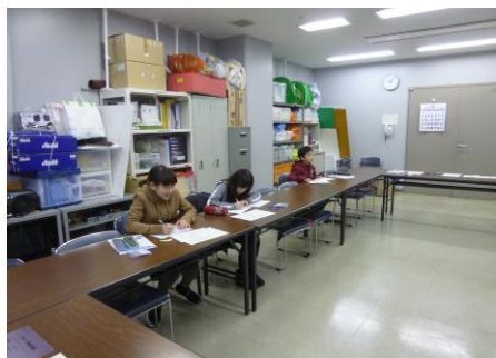
【手紙書き開始です】

2月22日（土）は、NPO法人あかねグループさんが高齢の方に届ける宅配弁当にそえる手紙書きをしました。参加した6人のメンバー全員が5年生ということで、学校の話や聴いている音楽のことなどを楽しく話しながら活動していました。春が近づいてきている季節に楽しみにしていることや卒業式の時期で6年生を送る会の話のほか、新型コロナウイルス感染症対策のことなど受け取る方々のことを思い浮かべながら手紙を書きました。イラストにも工夫した合計190通の手紙に1枚1枚色鉛筆などでていねいに色ぬりをして仕上げました。