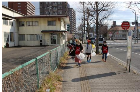
【草の中もゴミがありました】