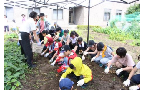
（たくさん収穫できました）