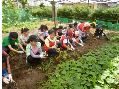
（いも掘り開始です）