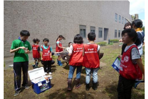
（お楽しみの焼きマシュマロです）