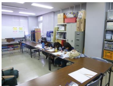
【ゲームの内容を確認しています】