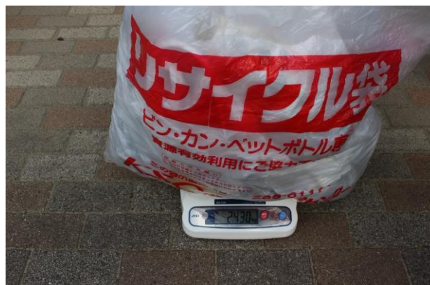
【最後に集めたゴミの重さを測りました。】