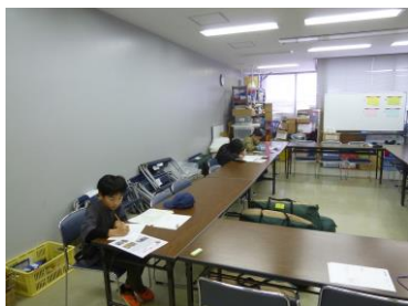
【砂浜に向かって移動中です】