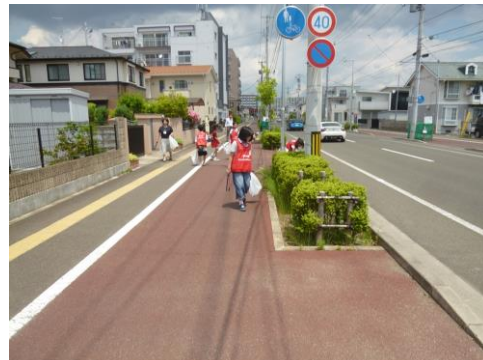
【植え込みなども注意して拾いました】