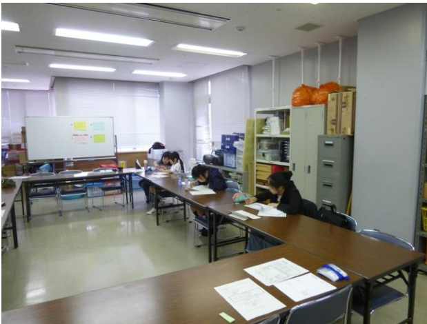
【新中学1年生も参加してくれました】

昨年度から継続して活動をしているメンバー18名で今年度のチャボ！の活動がスタートしました。これから管内の3つの小学校に新メンバー募集のチラシを配って、登録するメンバーを増やしていく予定です。第1回目の活動として、4月21日（日）にNPO法人あかねグループさんが高齢の方に届ける宅配弁当にそえるお手紙書きをしました。昨年度も毎月1回行ってきましたが、今年度も引き続き年間12回の活動として行っていきます。この日は、9名のメンバーが5月から新しい元号に変わる話題や新年度になって学校でがんばってみたいこと、季節に合わせて気をつけていただきたいことなど、手紙を受け取る高齢者の方々のことを思い浮かべながら心をこめて手紙を書きました。