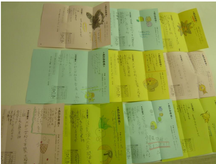
【イラストや内容に工夫して書き上げた手紙です】