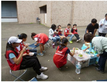
【そうめんをいただいています】