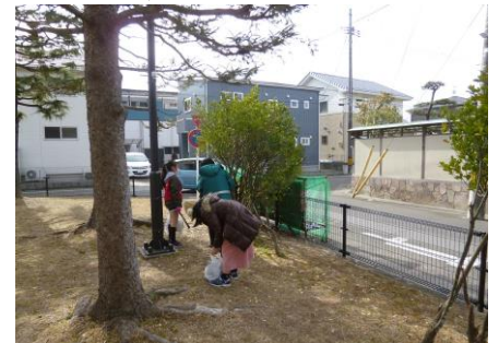
【公園の中でも拾いました】