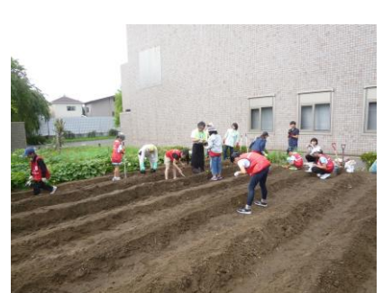
【大根の種まきもしました】