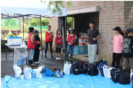
（活動内容の説明を聞いています）

7月28日（日）は若林区文化センター敷地内の畑で行われた「仙白園」夏のミニ収穫祭のお手伝いをしました。メンバー9人は「仙白園」参加者やジュニアリーダーの皆さんと一緒にじゃがいもや枝豆の収穫をしました。暑い日の活動になりましたが、皆さんと協力して収穫作業をがんばりました。その後、大学生の皆さんがきれいに洗ったじゃがいもを品種ごとに分けて袋に詰める作業も行いました。また、作業終了後には焼いたじゃがいものほか、枝豆やきゅうり、トマトの試食もさせていただきます。最後に焼きマシュマロをいただいたメンバーは大満足の様子でした。