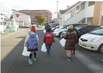
【ゴミ拾いに出発です】

2月8日（土）は、「まち歩きゴミ拾い隊」として大和町地区に今年度2回目のゴミ拾い活動に行ってきました。大和児童館を基点に歩道や公園などを歩きながらで1時間30分くらい活動しました。近くの学校に通っているメンバーからゴミの落ちている場所の情報を聞いて、植え込みの中も気をつけて見たり、手の届きにくいところでは2人で協力して拾うなど工夫をしてゴミを拾っていました。参加したメンバー4人が今回の活動で集めたゴミの量は、多くのたばこのすいがらやこわれたカサ1本のほか空き缶9本、空きビン3本など約2.5kgになりました。今回の活動中にも、何人もの地域の方から「ごくろうさま！」「ありがとう！」などと声をかけていただきました。