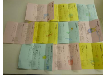
【7月に書いた手紙です】