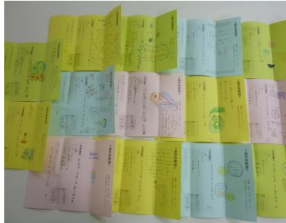
【6月に書いた手紙です】