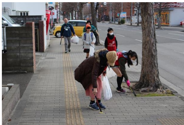
【細かいゴミも見逃さないように気をつけました】