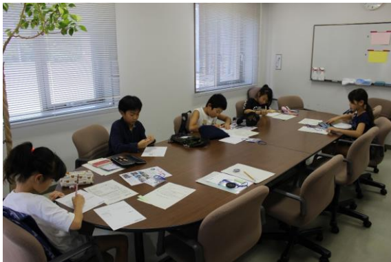
【真剣に手紙書きに取り組んでいます】

8月18日(日)はNPO法人あかねグループさんが高齢の方に届ける宅配弁当にそえる手紙書きをしました。暑い日が続いている中で気をつけていただきたいことや夏から秋に向かう季節の話題など、手紙を受け取った方のことを思い浮かべながら5人のメンバーで合計190通の手紙を書きました。