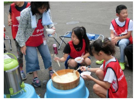
【おかわりをしているところです】