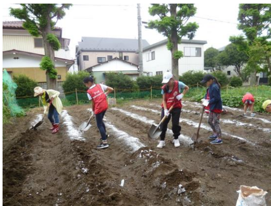
【スコップを使って肥料と土を混ぜました】