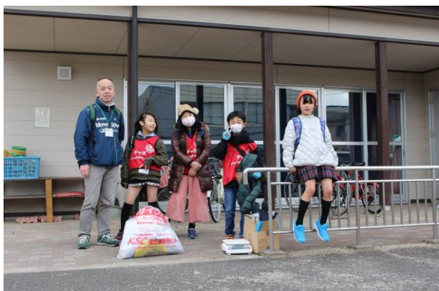
【活動終了です。みんながんばりました。】