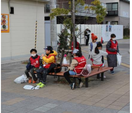
〔季節の話題などを書きました〕

PO法人あかねグループさんにそえる手紙 動から加わった新メンバーも寒い季節に気をつけてほしいか、新しい年に楽しみにしていとを思い浮かべながら手紙を夫した合計190通の手紙にいに色ぬりをして仕上げまし