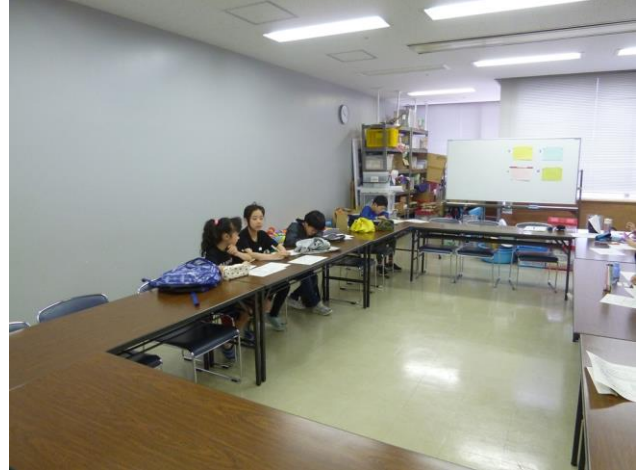
【楽しくお話ししながら活動しています】