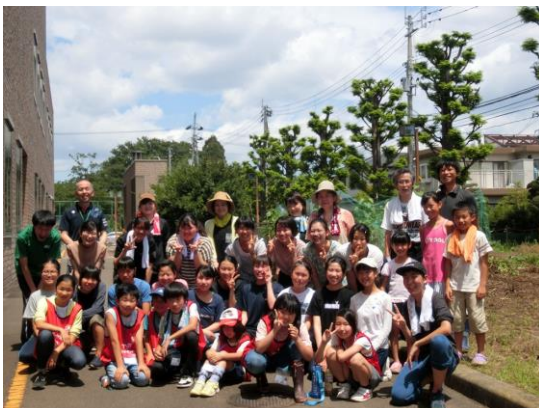
（参加者全員で集合写真を撮りました）