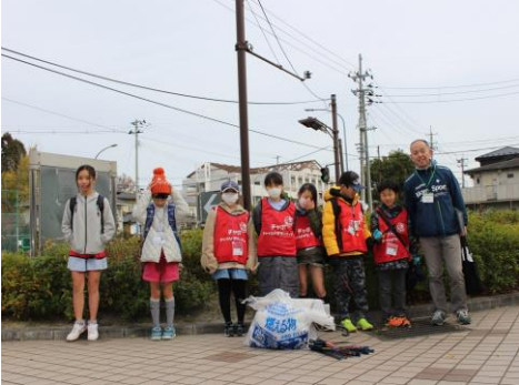
〔新メンバーもがんばっています〕