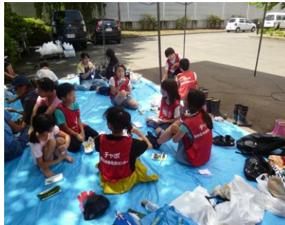
（休憩しながら活動しました）