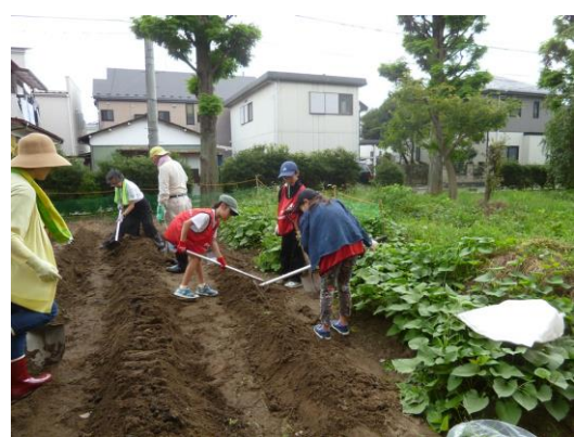
【鍬で畝を立てる作業もしました】