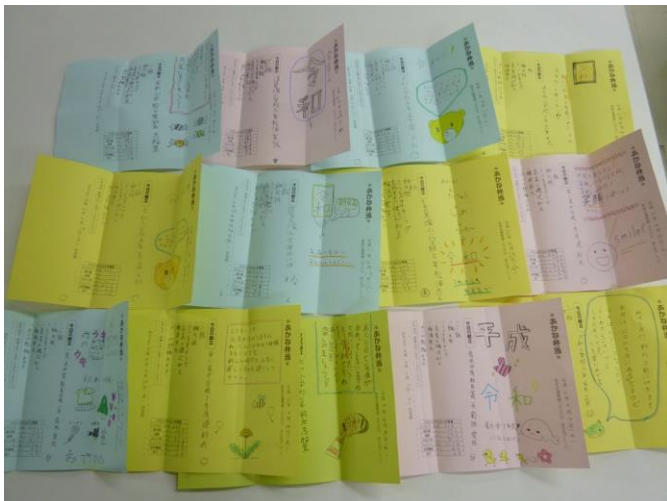
【完成した手紙・新元号の話題が多かったです】

今年度最初の活動だったので、今年のチャボ！の活動でがんばってみたいことを聞いてみました。）