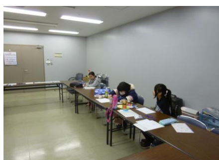
【楽しく話しながら活動しました】