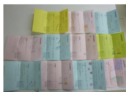
【完成した手紙です】