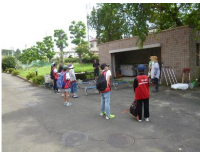
【朝の挨拶からスタートです】

8月24日（日）は若林区文化センター敷地内の畑で行われた「仙白園」白菜の苗植えのお手伝いをしました。初めに苗を植えるために畑の草取りをしました。その後で肥料を入れて土を混ぜたり、畝を立てる作業に取り組みました。きれいに整えた畑にチャボ！メンバーも種まきに協力して育てた仙台白菜の苗を植えました。「仙白園」参加者の皆さんと力を合わせてメンバー8人も一生懸命活動しました。苗植え終了後にはその場でゆでた「そうめん」を皆さんと一緒にいただきました。作業をがんばっておなかをすかせたメンバーは何回もおかわりをしながらおいしそうに食べていました。