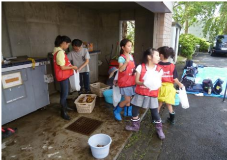
（品種ごとに分けて袋詰めしました）