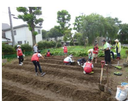
【間隔を測って苗を植えました】