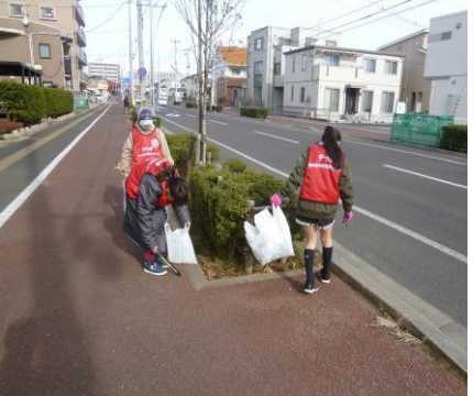
〔完成した手紙です〕