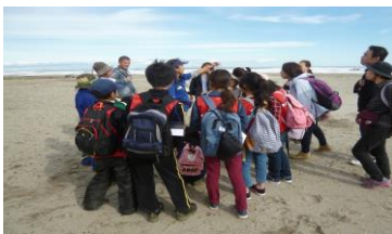
【みんなで昼食をいただきました】