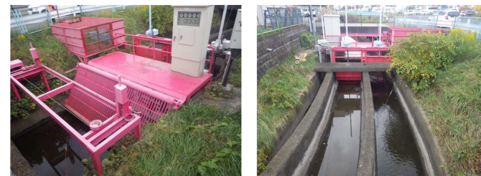
北から順に、大江堀・仙台堀・第一支用の3つに分岐します