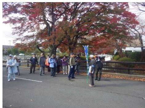
若林区役所の紅葉がとてもきれいです