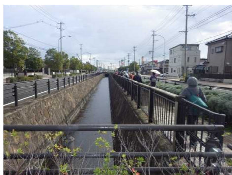
仙台堀をまっすぐ東へ