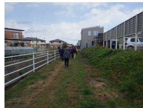
昔は七曲（ななまがり）と呼ばれ 7か所曲がっていたそうですが、 今では一直線になっています