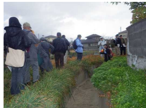
畑の中にある梅の木堀を確認 現在、梅の木堀は農業用水路としては使われていません