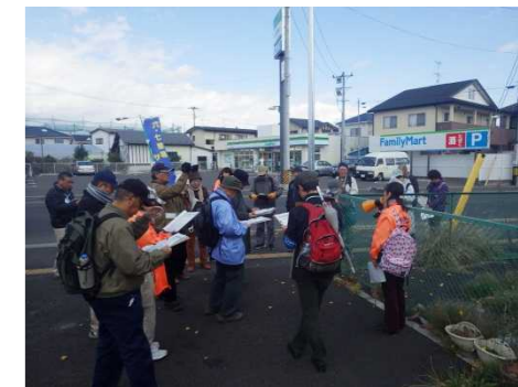
12:00 バス停「蒲の町」付近にて解散 寒い中、お疲れ様でした！