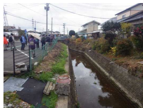
この辺りは昔、 「馬洗い場」と呼ばれていたそうです