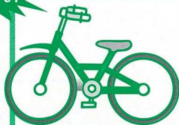
若林区交通事故(人身)件数

信号を無視して走り去る車。急に飛び出す自転車や無灯火の自転車など、ひやっとする場面によく出会います。危ないのは車だけではなくということを感じています。