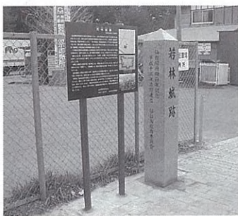
▲今年4月に建てられた「若林城跡」の石柱。若林城の歴史などが書かれている。宮城刑務所の北側にある。