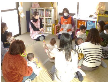
0歳サロン <栄養士さんと話そう>