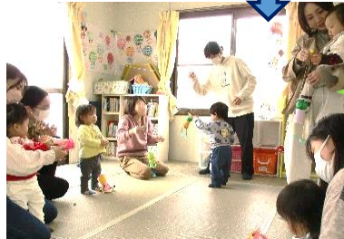
1歳サロン <手作りおもちゃ>