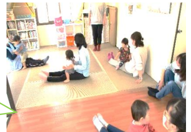
2・3歳サロン <ふれあいあそび>