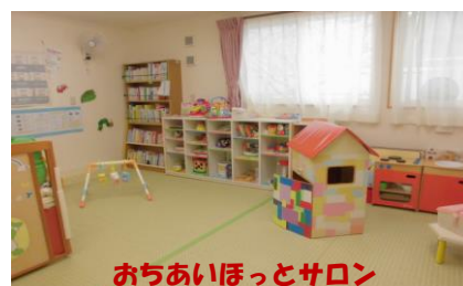
おちあいほっとサロン