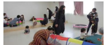
ホールでの遊びの時間の一コマ