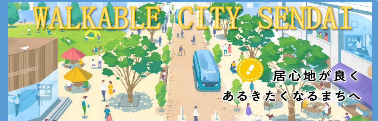
仙台市は、国土交通省の「ウォーカブル推進都市」に登録されています。

仙台市では、この取り組みを推進するため、都心部において、居心地が良く巡り歩きたくなるまちなか空間を形成するとともに、市民が快適に滞在できるオープンスペースを創出する「まちなかウォーカブル推進事業」を創設し、地域のまちづくり団体や民間事業者の皆様などと連携し、国の様々な支援制度などを活用しながら、公共空間や民地における滞在環境向上に資する事業に取り組んでいます。