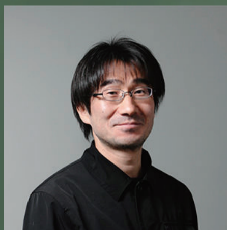
馬場 正尊 -Masataka Baba-

みかんぐみ共同主宰 / 東北芸術工科大学教授 / 建築家 1962年神奈川県生まれ。1989年東京工業大学建築学科修了。2009年より東北芸術工科大学でエコハウスの研究を開始。2014年山形リノベーションスクール総合プロデューサー