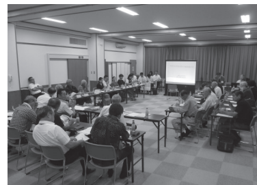
令和元年9月6日（金）18:30～21:10 会場：実沢コミュニティ・センター

実沢小学校のあり方を判断する大切な話し合いですので、地域にお住まいの皆様にご様子についてお知らせいたします。