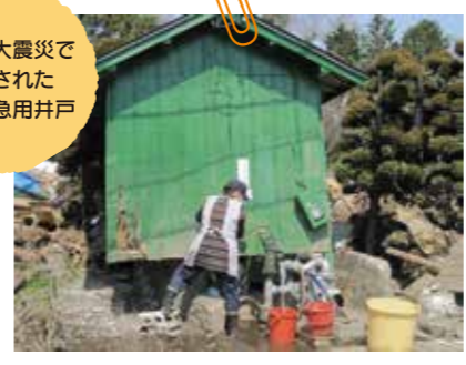
津波が浸水し、電気も水道も止まっていましたが、手押しポンプで汲み上げた井戸水を使って、住民の皆さんが清掃等を行っていらっしゃいました。 (若林区笹屋敷地区、平成23年4月14日撮影)