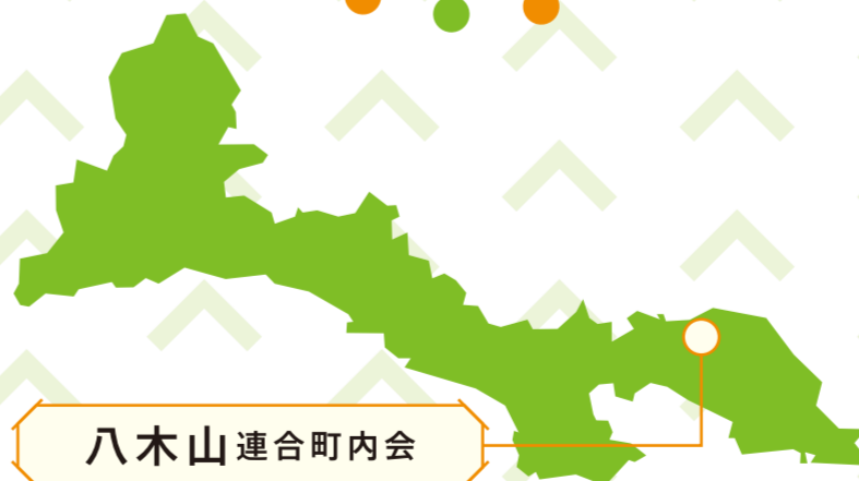
八木山連合町内会