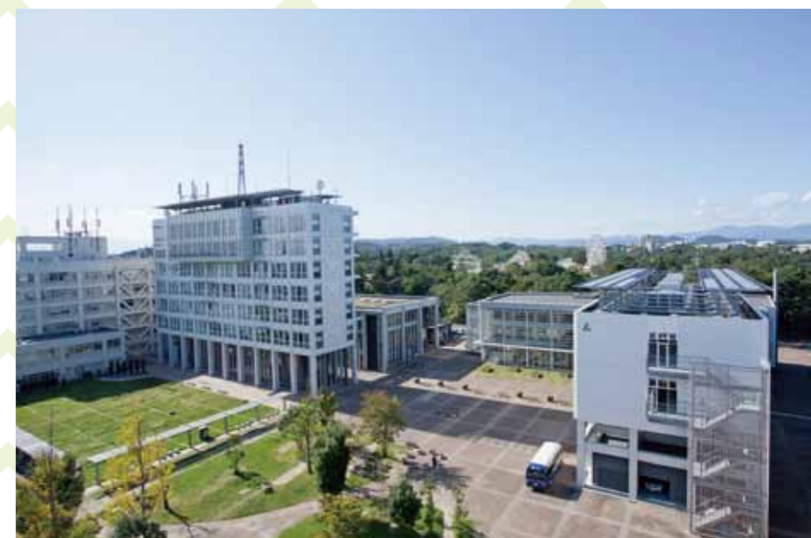
東北工業大学：八木山地域に密着した大学