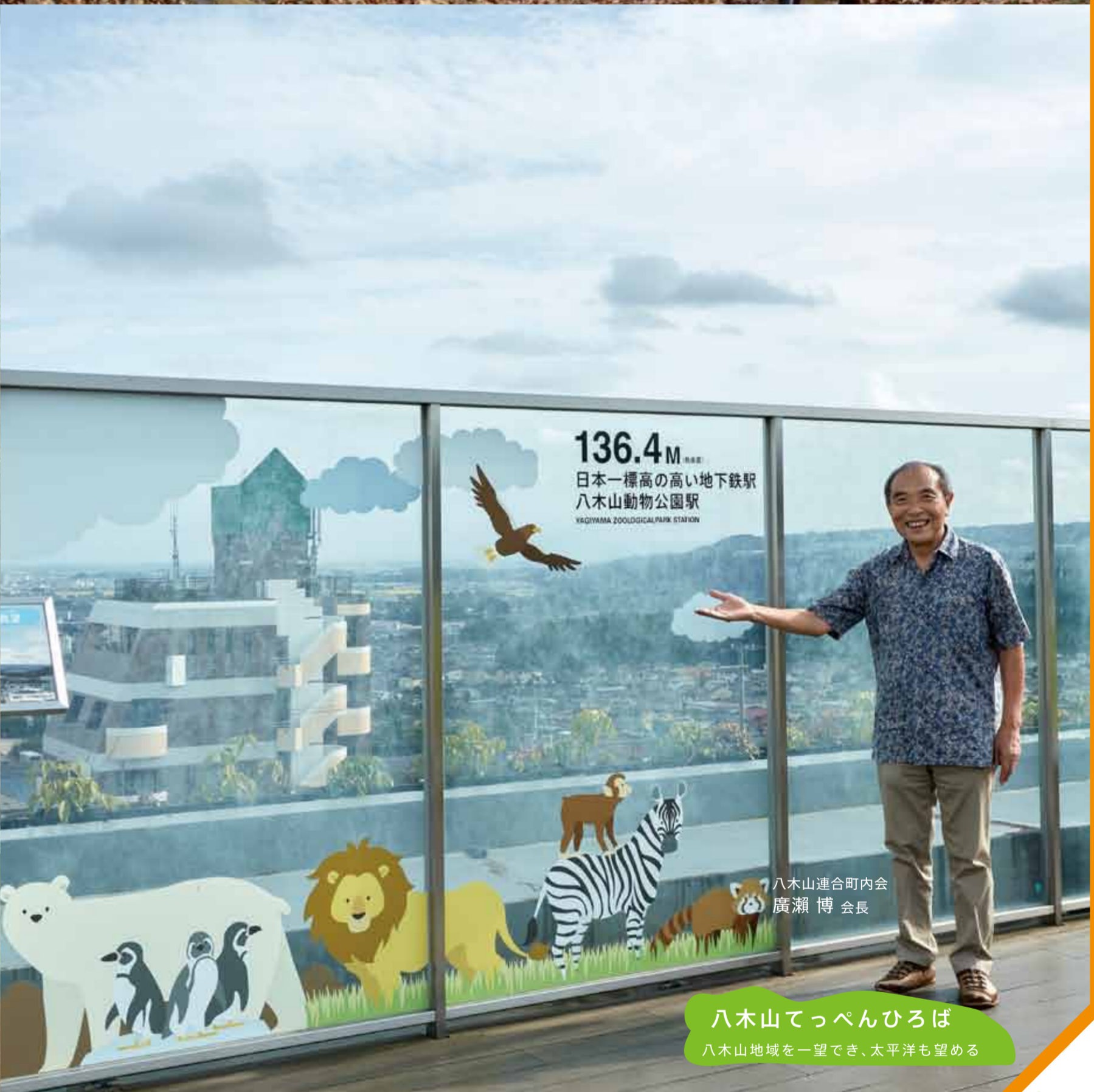
八木山てっぺんひろば 八木山地域を一望でき、太平洋も望める