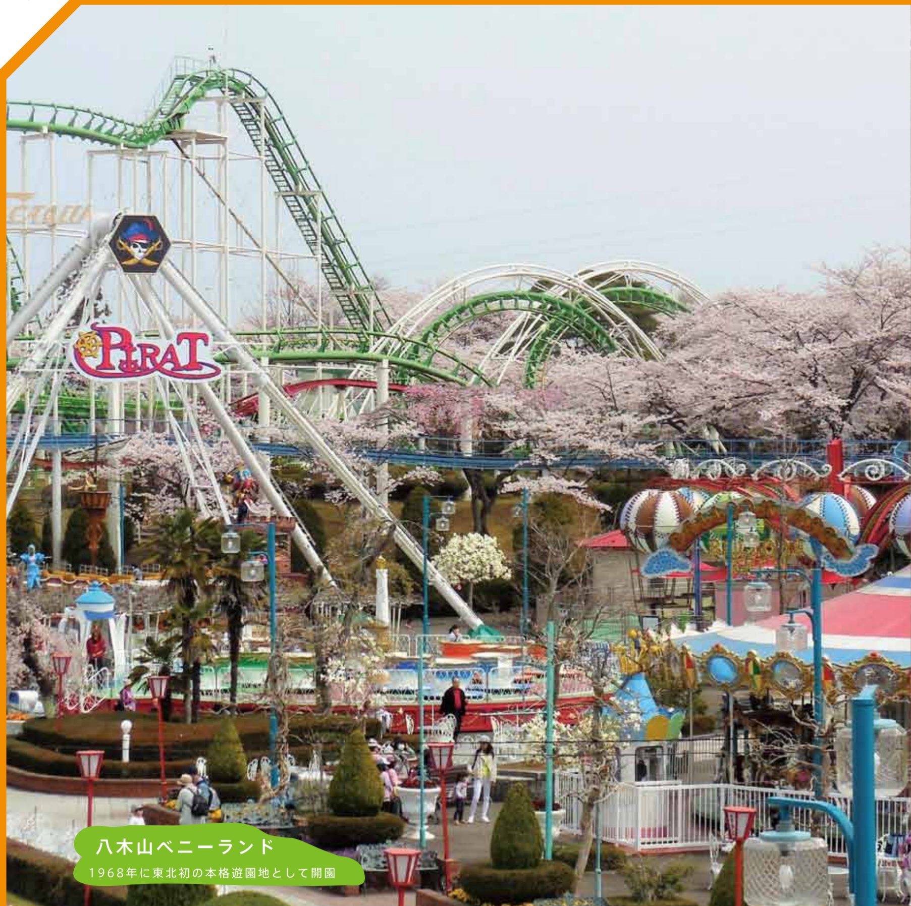
八木山ベニーランド 1968年に東北初の本格遊園地として開園