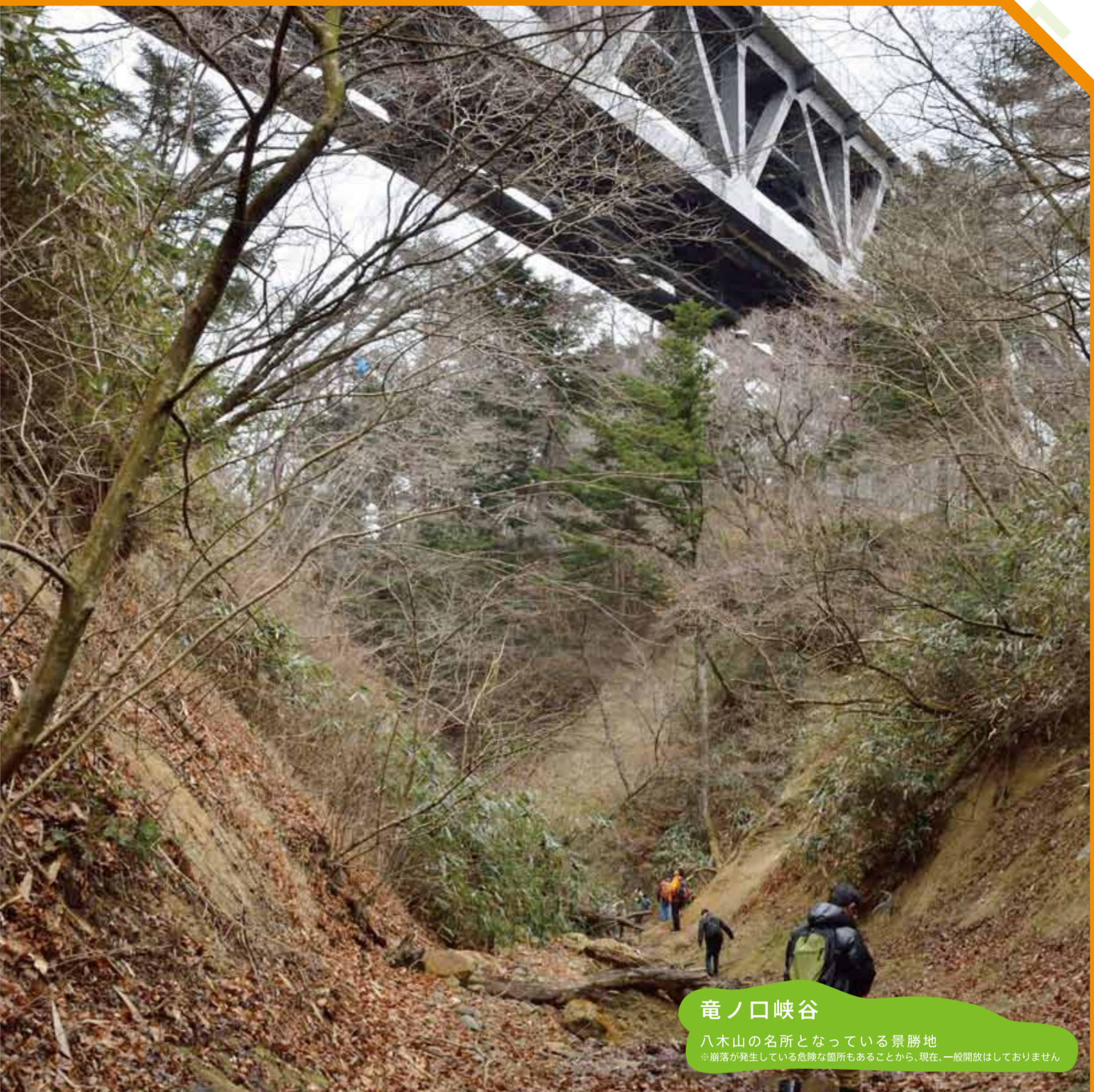
竜ノ口峡谷 八木山の名所となっている景勝地 ※崩落が発生している危険な箇所もあから、現在、一般開放はしていません