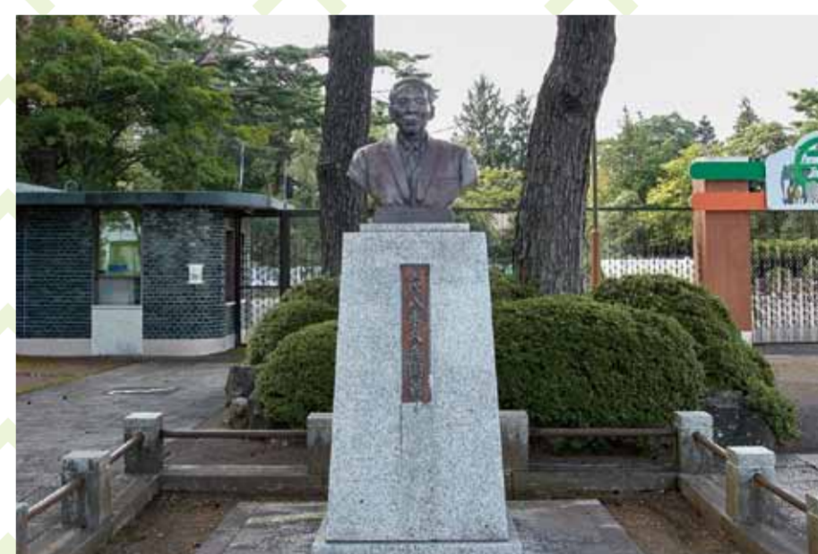
八木久兵衛像：八木山の開発に尽力した人物