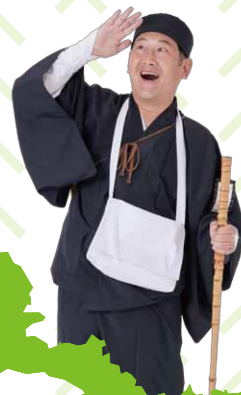
東中田町内会連合会