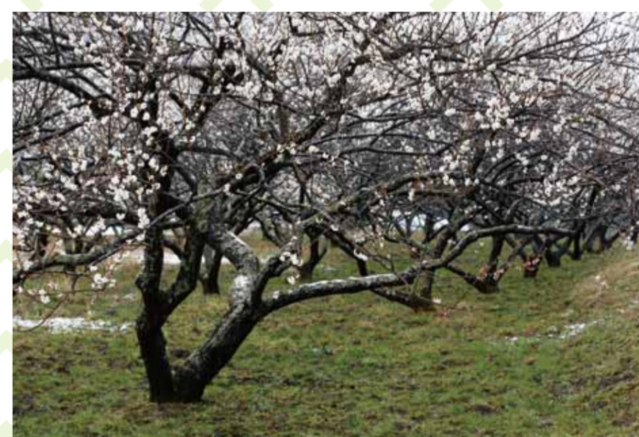
梨野の梅木群:白加賀など4種100本以上の梅の開花は見事

茂庭台地域には様々な福祉施設があり、安心・安全なまちづくりを目指して活動に取り組んでいます。梨野地区の『一本桜』『梅木群』はこの周辺の豊かな自然の象徴です。700年もの歴史を誇る『神明神社』は地域との結びつきが深く、以前は集会場や子どもの学習場としても利用されていました。