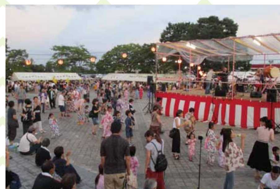
天空の広場:夏祭りや各種交流イベントを行う地域のコミュニティの場