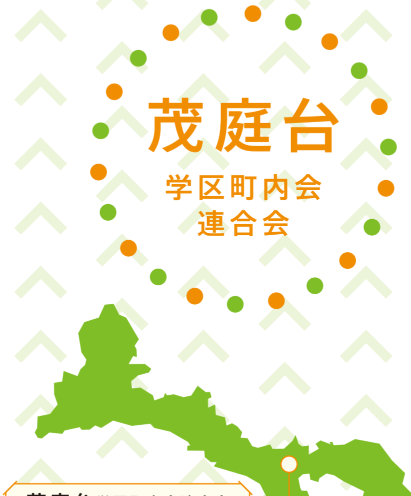
茂庭台学区町内会連合会