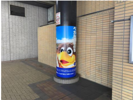
泉中央駅アドピラー広告