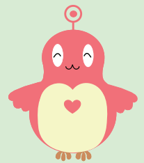
仙台市障害理解促進キャラクター 「ココロン」