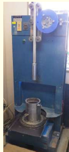
土質試験機器(自動突固め試験)

現在では、企業から支援機関に対しても積極的に連絡を行うようになり、4者が一つになって、企業全体で障害のある方の雇用を推進する土壌が醸成されています。