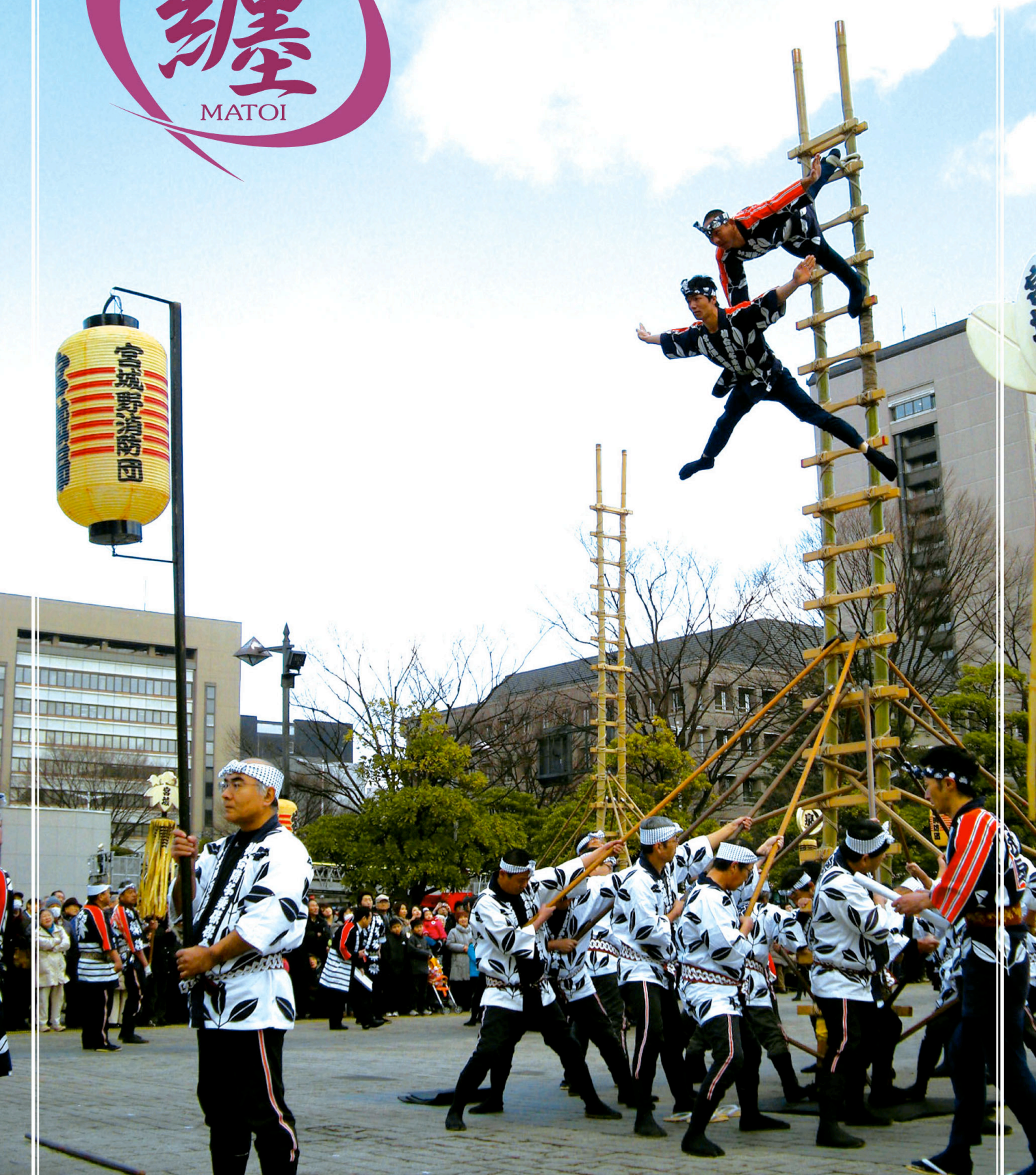
'10 仙台市消防出初式 市民広場