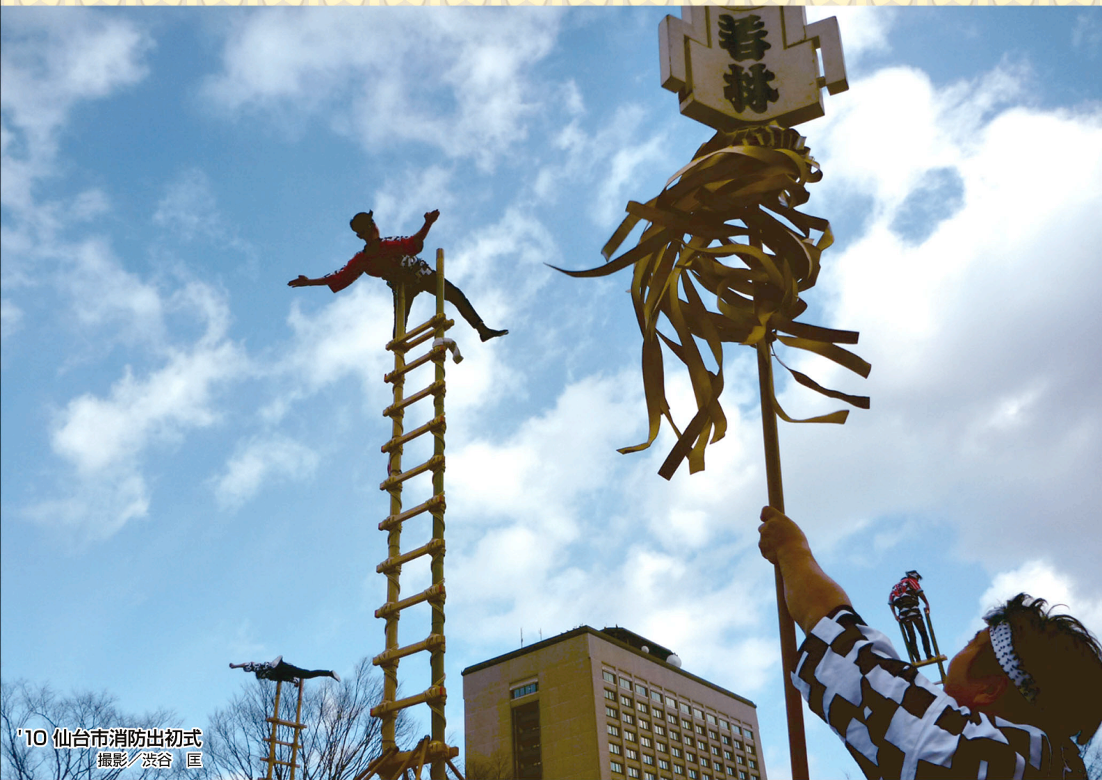
'10 仙台市消防出初式