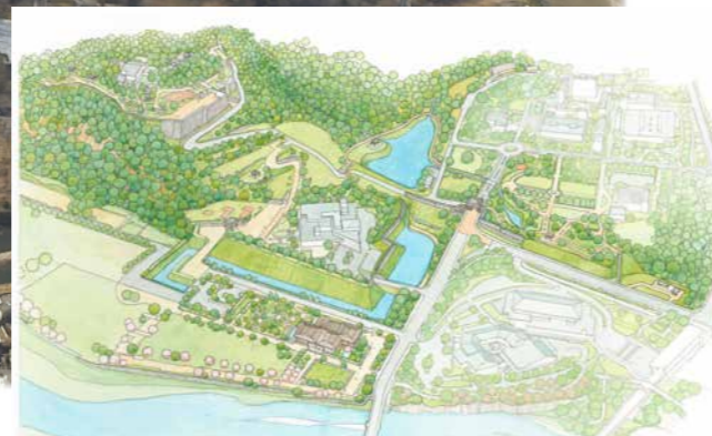
整備全体のイメージ図(本質的価値が顕在化された姿) ※現時点での整備イメージ図であり、今後整備内容を変更する場合があります。