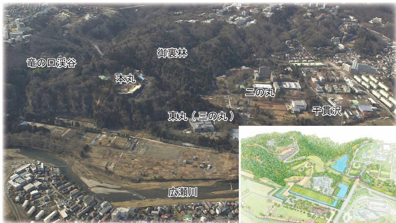
仙台城跡航空写真(2016年撮影)