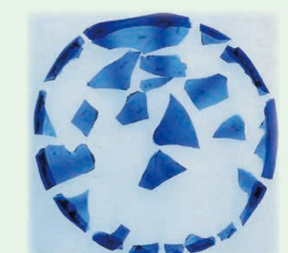
出土遺物 (ヨーロッパ産硝子器)