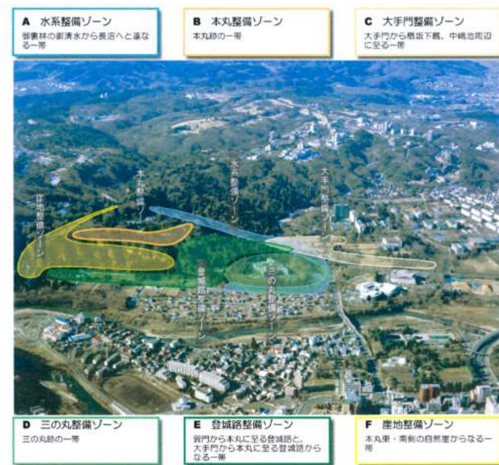
図 9-1 整備ゾーン概念図 (「仙台城跡整備基本計画」平成 17 年 3 月より)