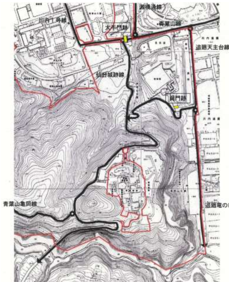
図 11-1 大手門跡の位置と市道