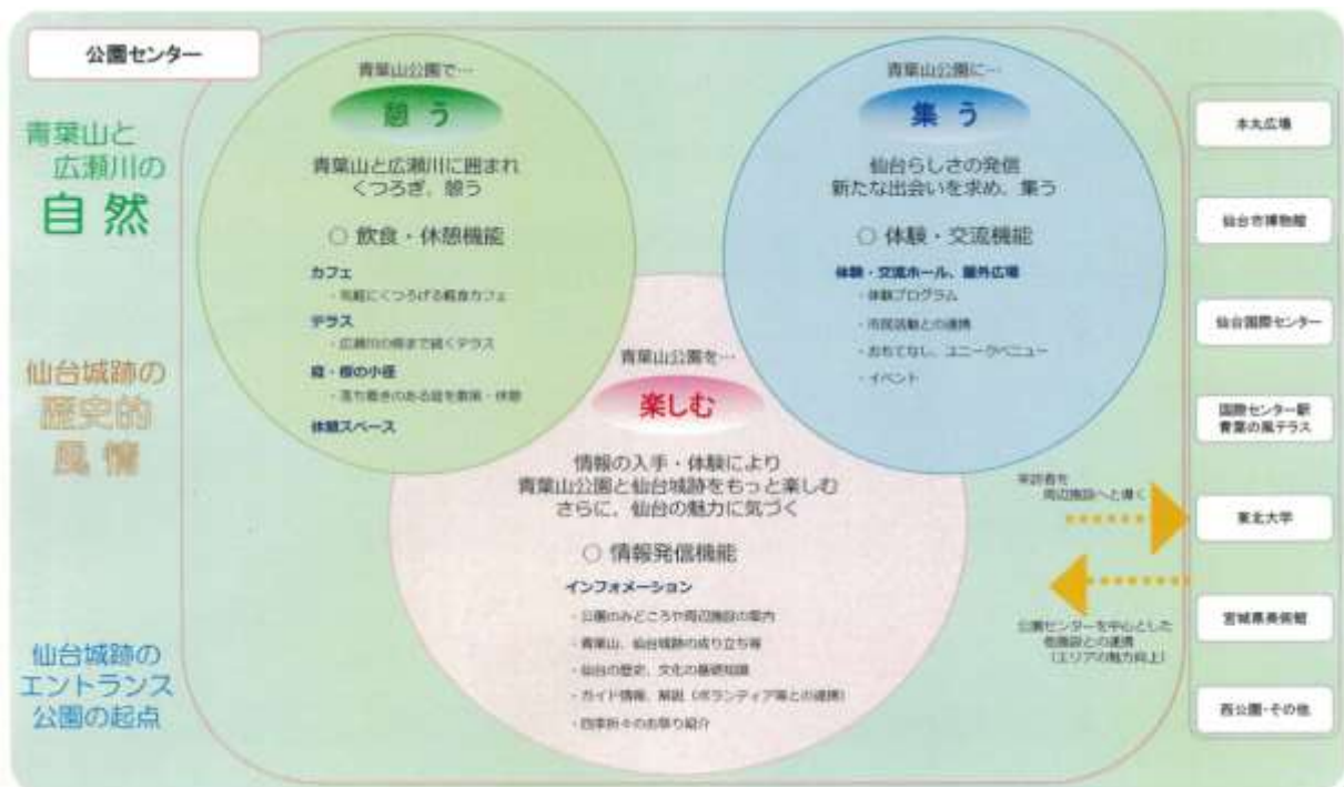
図 8-1 （仮称）公園センターの機能展開図 （「青葉山公園（仮称）公園センター基本計画」平成 29 年 4 月より）