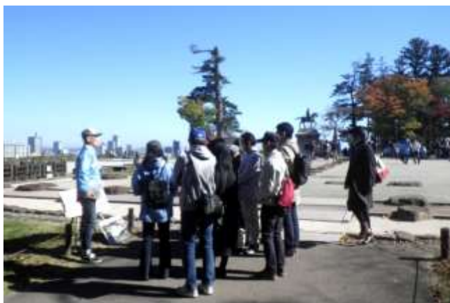
図 8-2 本丸大広間跡でのボランティアガイド活動

市内にはその他の構成文化財として、陸奥国分寺薬師堂、東照宮がありますが、これらも含めた活用事業も検討していきます。陸奥国分寺跡は、地下鉄東西線の駅に近く、平成29年度には史跡整備を行い「史跡陸奥国分寺・尼寺跡ガイダンス施設」が建設されましたので、今後より一層、活用をすすめていきます。