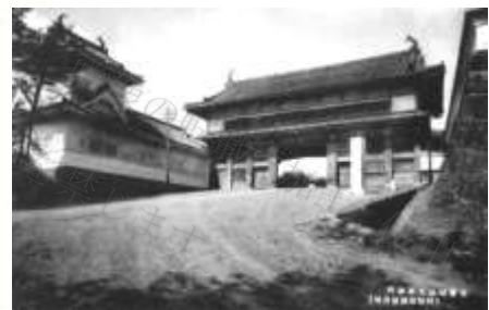
図 11-3 大手門の古写真