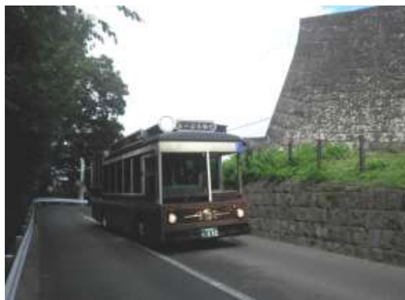
図 8-3 仙台城内を走る「るーぷる仙台」