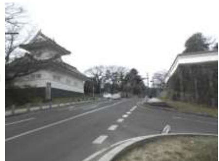
図 11-2 大手門跡の現況