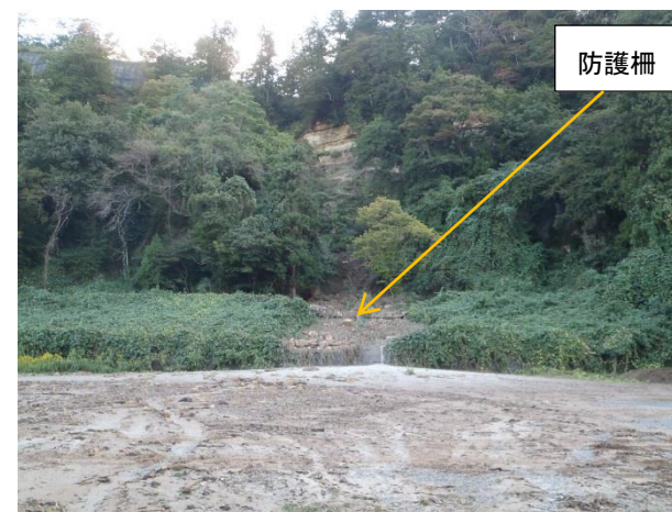
写真1 ①本丸東側崖面崩落全景