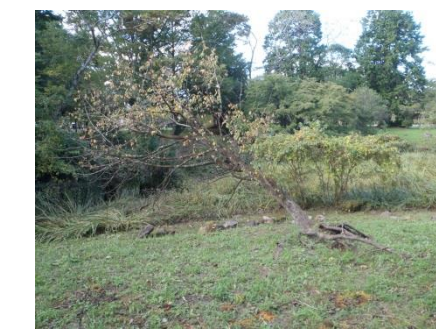
写真5 ③二の丸堀跡倒木