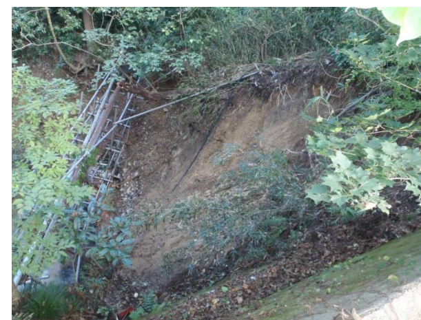
写真3 ②五色沼西側崖面崩落状況