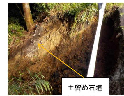
写真6 ④本丸西部市道法面道路際