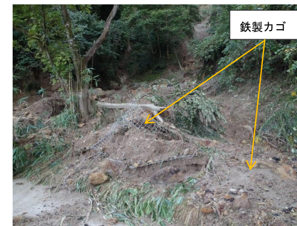
写真2 ①本丸東側崖面崩落斜面下部