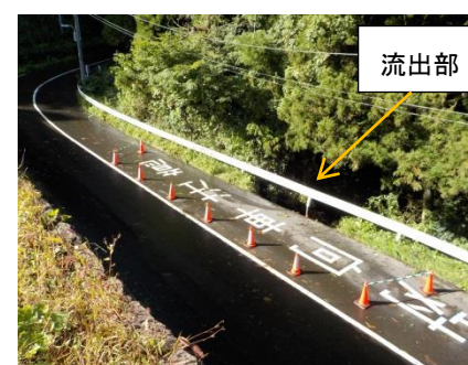
写真5 ④本丸西部市道法面流出