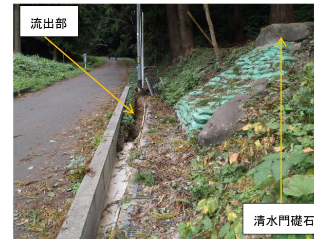
写真4 ③清水門跡市道側溝流出