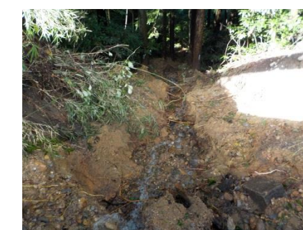
写真7 ④本丸西部市道法面谷側