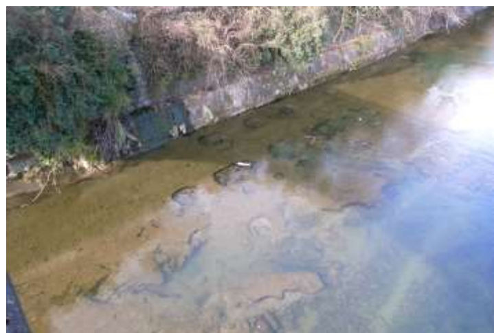
①河床の穴と、切石積み石垣