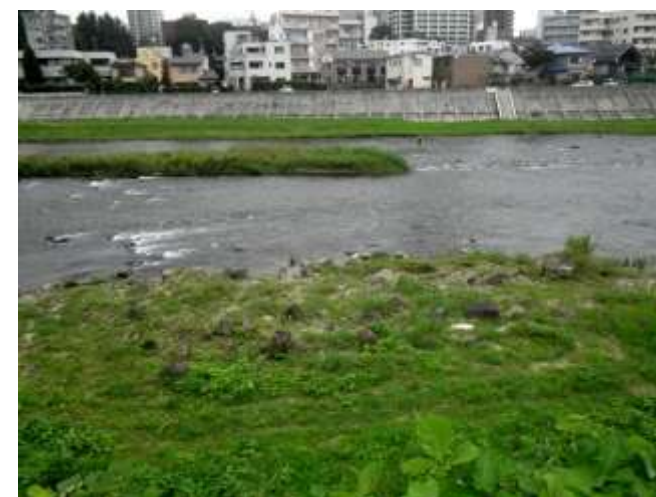
⑥河川敷に散在する石垣石材