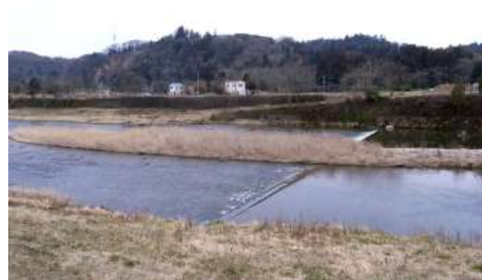
③護岸石垣（奥が本丸跡）