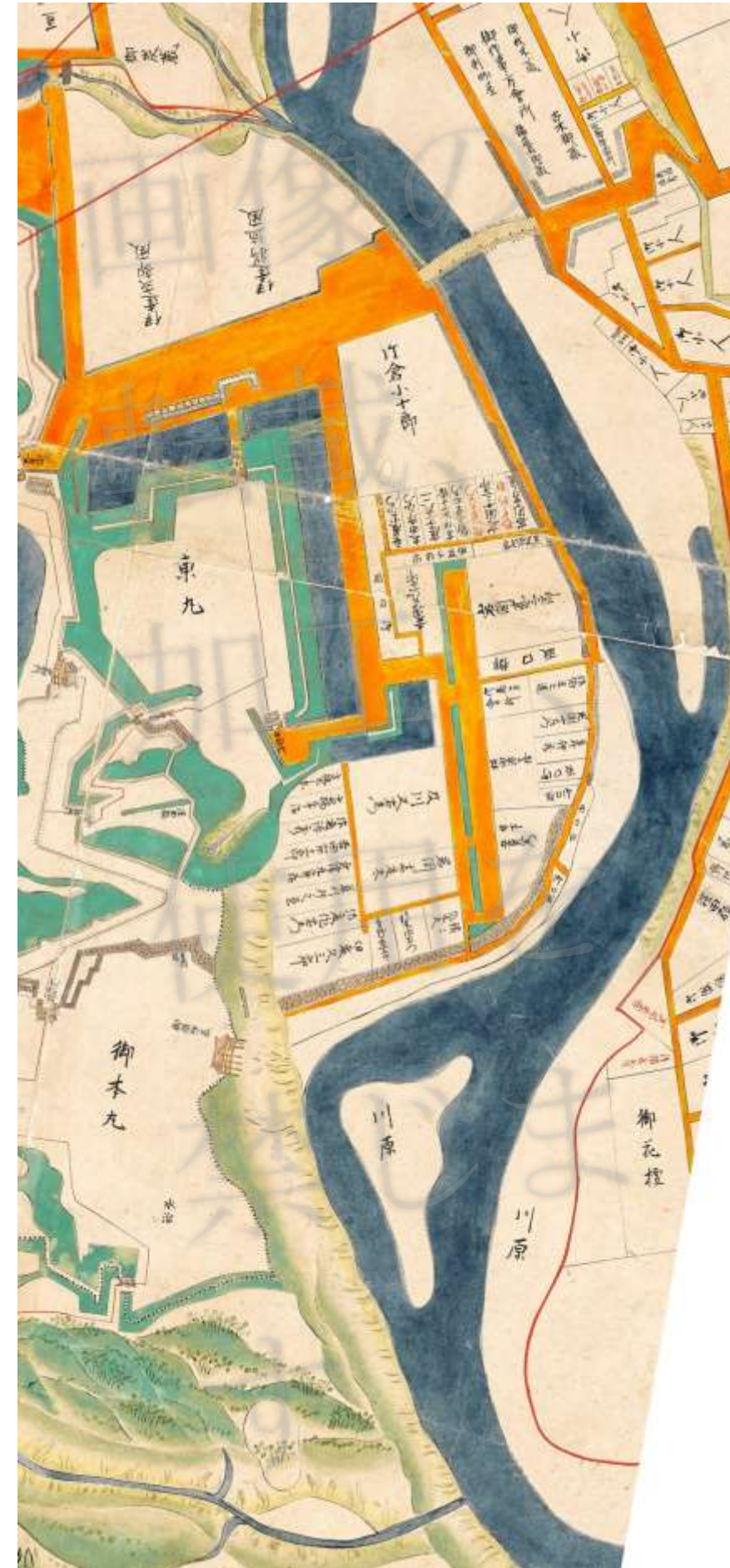
仙台城下絵図（1789 寛政元） 仙台市博物館所蔵