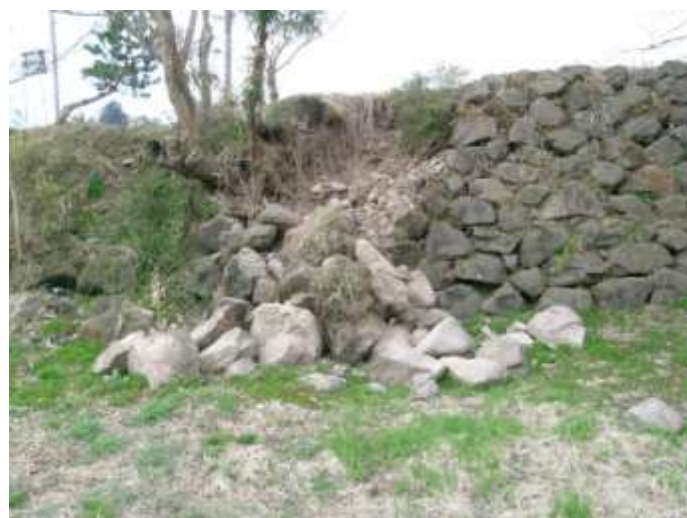
⑤東日本大震災で被災