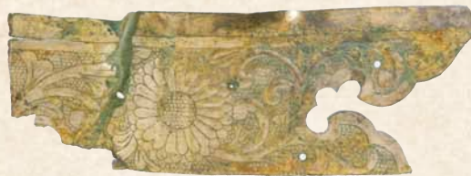
在发掘调查中发现的金铜金属零件