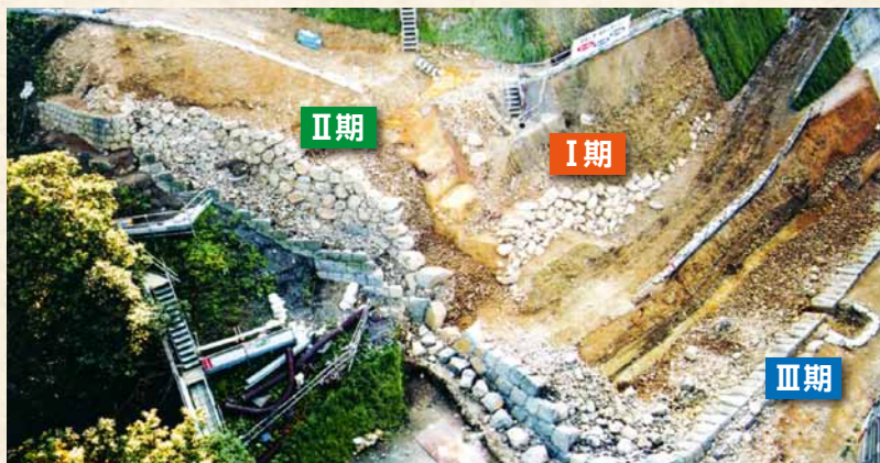
本丸东北部的石墙(从东北)

本丸北壁的石墙,是于1997年~2004年实施修复工程,在伴随施工的发掘调查中,从现在的石墙的背面,发现了第2期的旧石墙。最古老的第I期石墙,是政宗建造城堡时17世纪初期,把未经加工的天然石,长形石块横着垒砌的石墙。其下一阶段的第II期石墙,是17世纪前半期,在天然石上多少经过加工,把长形石块以前后形式垒砌的石墙。现在的第III期石墙,是因1668年的地震修复,于17世纪后半期修筑的石墙,把表面全部用经过加工的石块,按接缝垒砌而成的石墙。