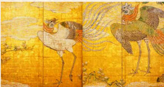
「凤凰图屏风」(松岛顶町收藏)