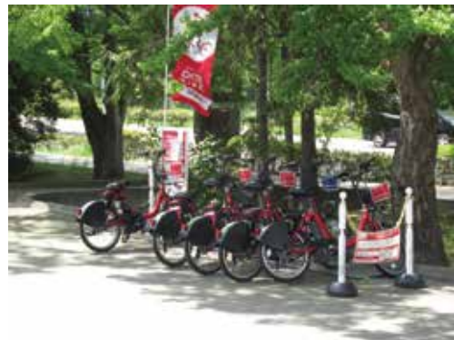
図 5-2 DATEBIKE(コミュニティサイクル)駐輪場