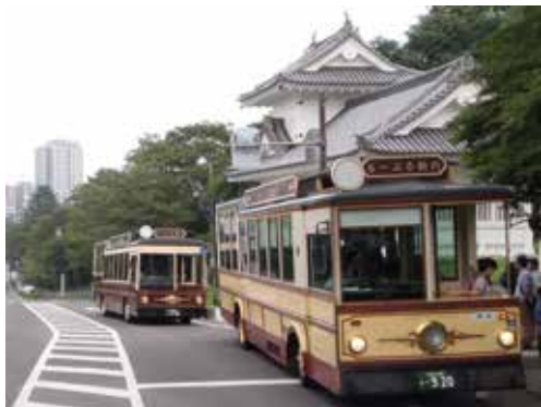
図 5-1 るーぷる仙台

仙台観光国際協会や、隣県の自治体で構成される伊達な広域観光推進協議会等により、主要な関連歴史資産を巡るモデルコースが複数設定されていますが、公共交通機関では来訪しにくい箇所もあり、複数の移動手段を利用した広域な関連歴史資産を巡るためのモデルコースが設定されていません。そのため、関連歴史資産を効果的に回遊するための広域なモデルコースを関係機関と連携して設定する必要があります。