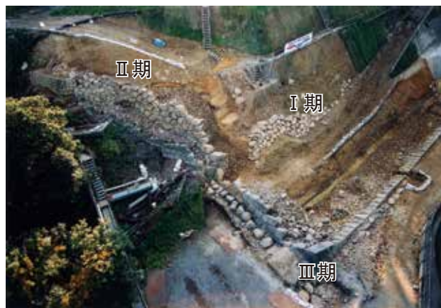
図 4-3 本丸北壁石垣で確認した3時期の石垣