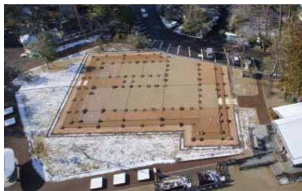
図 4-4 遺構表示された本丸大広間跡