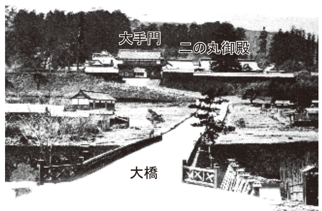
図 4-2 大橋付近からみた明治初期の二の丸跡