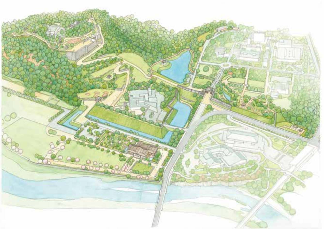
図 4-6 整備全体のイメージ図（本質的価値が顕在化された姿）