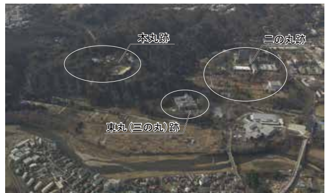
図 4-1 仙名城跡の基本的形状