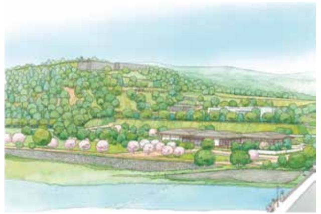
図 4-5 仙台城跡東側（市街地方面）からの整備イメージ俯瞰図

曲輪等の全体的地形／城郭の一部としての自然地形／天然記念物青葉山／水利システム／眺望