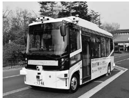
▲車両に搭載されたセンサーで、常に周囲の道路状況や人の動きを確認しています

約7千人の方が追悼に訪れ、犠牲となられた方々のご冥福をお祈りしました。 市では、回遊性の向上を目指す青葉山エリアにおいて、自動運転のEVバス(電動バス)を運行するサービスの実現に向けた取り組みを行っています。