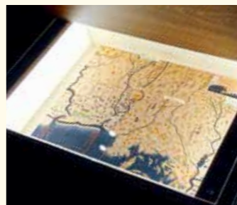
▲仙台城周辺を抜き出し、当時の宿場町などを紹介

博物館最大の収蔵資料である「奥州仙台領国絵図」など、大型の絵図の内容を手元で見られる引き出しケースを新設しました