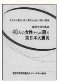
NPO法人イコールネット仙台/編・刊

「東日本大震災に伴う『震災と女性』に関する調査」聞き取り集 40人の女性たちが語る東日本大震災」