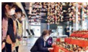
▲行方不明者の人数の10分の1に当たる260体を飾っています

東日本大震災後、行方不明者の帰りを願う「かえりびな」作りに取り組み、「仙台かえりびなの会」の皆さんにお話を伺いました。