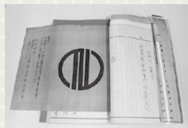
▲昭和8年に市章を制定した際の資料