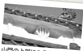
山門の上部にある白い「三引両」が目を引きます