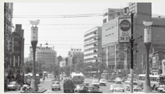
▲モニュメントが設置された昭和38年ごろの仙台駅前（青葉通方面）の様子

そのカッコウをかたどったモニュメントが宮城野区の「原町カッコウ公園」にあります。これは、かつて観光客などを出迎えるため、仙台駅前に設置されていたもの。30分間隔でカッコウの鳴き声が流れ、市民からも親しまれていましたが、ペDESTリアンデッキ建設に伴い、昭和52年に撤去されました。その後、地域の商工会等により現在地に設置され、今も仙台のまちを見守っています。