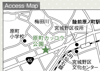
JR「陸前原ノ町駅」から徒歩約7分