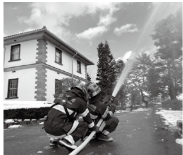
▲火災防御訓練では、消防職員が一斉放水を行いました