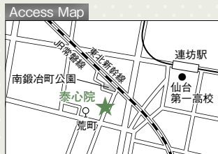
「荒町」バス停から徒歩約2分、地下鉄「連坊駅」から徒歩約10分