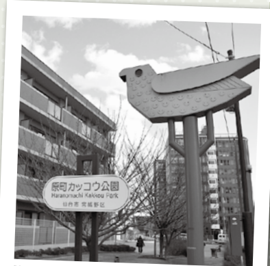
現在は1日3回、「カッコー」と鳴き声が流れ、人々に時を知らせています（月～金曜日は8:00、12:00、17:00。土・日曜日は10:00、12:00、15:00）