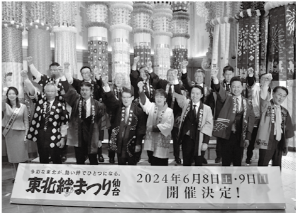
▲6市・6祭り団体・6商工会議所で構成される東北絆まつり実行委員会が共同記者会見を行い、思いを一つに、大きな掛け声で絆まつりの成功を誓いました

東北の県庁所在地6市の6祭りが集結する東北絆まつりは、東日本大震災からの復興を願い開催された「東北六魂祭」の後継イベントとして、平成29年から本市を皮切りに6市持ち回りで開催。途中、コロナ禍での延期も余儀なくされましたが、昨年の青森市での開催