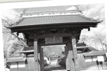
荘厳なたたずまいの泰心院山門