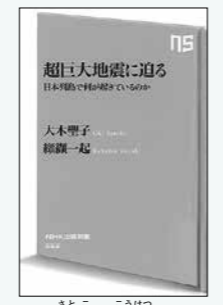
大木聖子・藤原一 著 NHK出版 刊

「3・11キラクのキラク、そしてイマ。2021」もあります。紹介した本は、市民図書館でご覧いただけます。問市民図書館 ☎261・1585