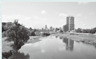
▲広瀬橋から見た上流側の景色。 都市と自然の調和を感じられます

昭和34年には、より強度を増した橋に再度架け替えられました。かつては市電が橋の上を走っていましたが、昭和51年の市電廃止後に修繕が行われ、自動車、歩行者用の橋となりました。