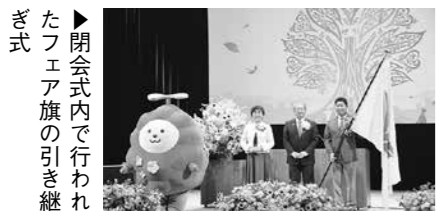
▶閉会式内で行われたフェア旗の引き継ぎ式