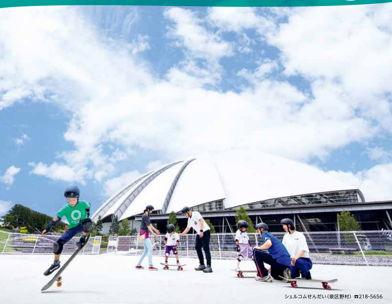
シェルコムせんだい(泉区野村) ☎218・5656