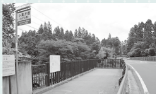
▲眼下に眼鏡橋が見えるスポット