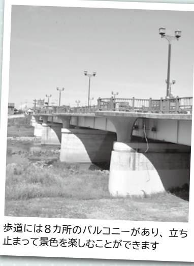
歩道には8カ所のバルコニーがあり、立ち止まって景色を楽しむことができます