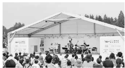
▲公式テーマ曲「feel the green」も披露されました

演奏も行われ、54日間の祭典を盛大に締めくくりました。花壇づくりや来場者へのおもてなしなど、市民とともに作りあげてきた今回のフェア。培った経験や取り組みを、次の百年の杜づくりへつなげていきます。