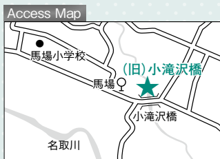
「馬場」バス停から徒歩約2分