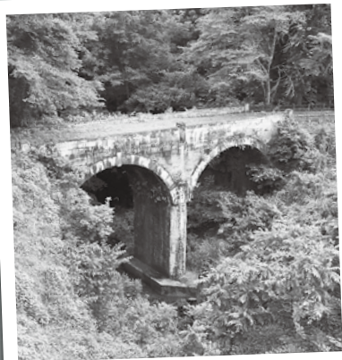
水面にアーチ橋が映り込むと、眼鏡のように見えることから「眼鏡橋」と呼ばれます ※現在(旧)小滝沢橋は通行できません