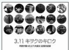
NPO 法人 20世紀アーカイブ仙台/企画・編集・制作・刊

震災後の被災地を撮影した写真集で、被災した市民がそれぞれの目線で記録したものです。撮影日時は、震災当日から数カ月後まで、撮影場所も、宮城県内の多くの被災市町にわたっています。何より記録としての価値は、日時、撮影者、場所が全てに表示されている点で、離れた多くの地点で同時に撮影が可能になったのは、カメラ付き通信媒体の普及で、皮肉にも途切れた通信機能を補完できたからでしょう。「3・11」を写真で残す、と「3・11」を文字で残す、の2部構成。その後の定点記録図書として「3・11キラクのキラク」そして「イマ」。