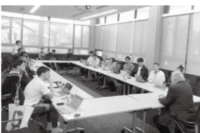
▲スタンフォード大学のリチャード・ダッシャー教授による講義に参加後、意見交換を行いました。