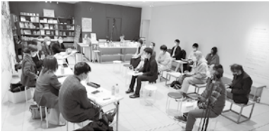
▲せんだい3.11メモリアル交流館で 行われた「災害文化ってなに？」と題 した公開パネルディスカッション

市では、震災の記憶と経験を未来へ つなぐため、平成25年に仙台市震災復 興メモリアル等検討委員会を設置。平 成26年に同委員会より市中心部と沿岸 部の2カ所に震災メモリアル拠点を整 備する方向性が示されました。平成28 年に、震災を知り学ぶ場であり、人と 人の新たなつながりを生み出す役割も 担う沿岸部の拠点「せんだい3・11メ