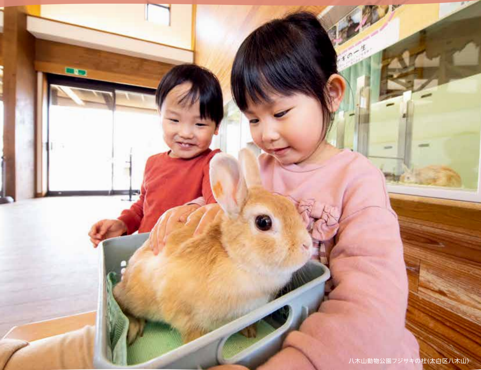
八木山動物公園フジサキの杜(太白区八木山)

八木山動物公園フジサキの杜のふれあい館では、ウサギやモルモットと触れ合う体験ができます。かわいらしい動物たちに会いにぜひご来園ください。