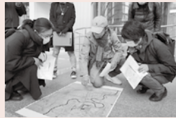
▲1月に実施された「せ んだい・立直りのコンセ キ巡り」。専門家の案内 で災害の痕跡を巡りまし た

豪華絢爛な仙台七夕が災害と 深い関わりがあることをご存じ ですか？ 関東大震災後の大不 況を乗り越えようと、商店街で 発案されたのが「七夕飾りつけ コンクール」。これを機に互い に競い合うようになり、七夕飾 りは年々豪華になっていきました。 災害から立ち直った痕跡も 災害文化であり、暮らしの身近な ところに残っています。