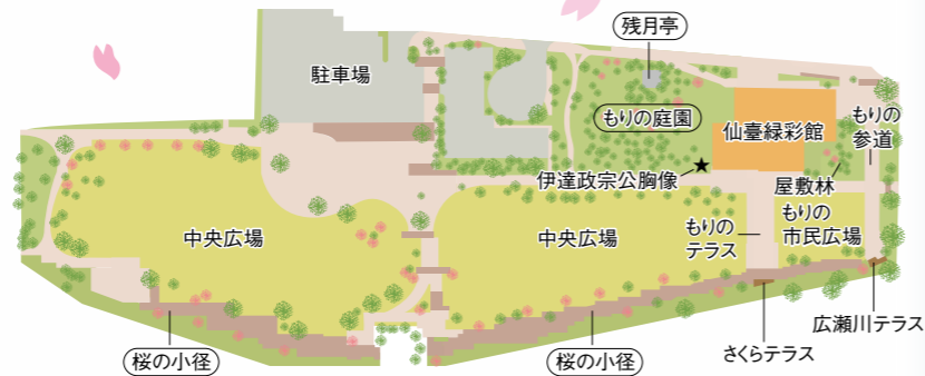
※全国都市緑化仙台フェアの開催期間中は、中央広場に大花壇などが設置されるため、イメージ図とは異なります