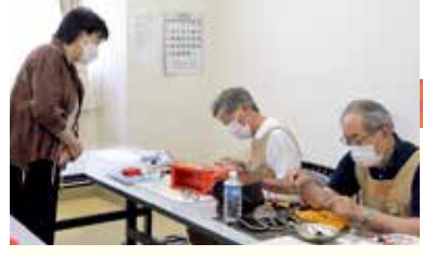
▲部品の接着や断線のハンダ付け、さび取りなど、細かく作業されていました