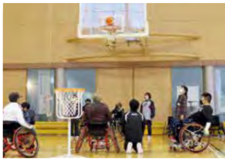
障害のある方もない方も一緒に楽しむ「ウエルフェアスポーツ」の開催などを通して、障害理解促進に取り組めます

ひきこもり状態にある子や障害のある子の親を対象に、親なきあとの経済的な課題等の解決に向けた学習会や相談会を新たに開催するほか、重い障害のため就労に困難を抱える方に対し、通勤中・就業中の支援を開始します。また、障害児支援や地域生活支援体制の充実、障害理解、就労と社会参加の促進、安心して暮らせる生活環境の整備などの各種施策を展開します。