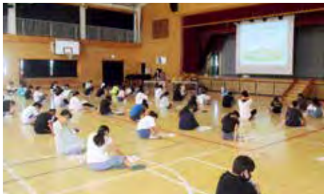
小・中学生を対象とした生活習慣病予防に関する健康教育（写真は六郷小学校）

六郷地区健康づくり推進事業 六郷地区の住民や地域の団体を対象に、健康課題解決に向けた取り組みを行い、健康に暮らせる地域づくりを進めます。