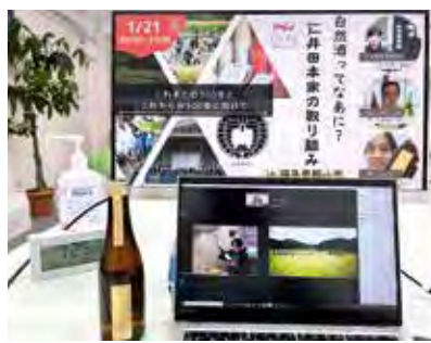
ホームページ「オラツー東北!」では、自宅にいながら東北の魅力を感じられるオンラインツアーを紹介しています

験できるローカルツーリズムを推進するほか、オンライン観光の推進や、東北の夏祭りを活用した観光物産プロモーションなどを通じて交流人口の拡大につなげます。