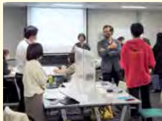
「みやぎの・まちづくり若手人材育成支援事業」では、若者がまちづくりについて意見交換を実施

区民の皆さんと協働でまちづくりを進めます。「みやぎの・まつり」の開催や「宮城野盆唄」の普及、子育て、防災、地域の魅力発信などの取り組みを行うほか、公募によるまちづくり活動への助成を行います。また、次代のまちづくりを担う若手人材の育成を目的として、研修会等を開催するとともに交流の機会を創出し、ネットワーキングを促進します。