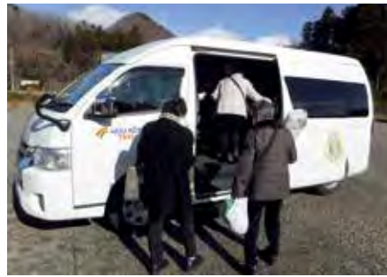
太白区秋保地区の乗り合いタクシー「ぐるりんあきう」。地域住民が主体となり、本格運行に向けた検討を進めています

鉄道やバスなど、公共交通を中心とした利用しやすい交通体系の構築に取り組みます。地域交通の試験運行や本格運行に係る経費の助成を行うなど、移動手段の確保に向けた地域主体の取り組みを支援します。