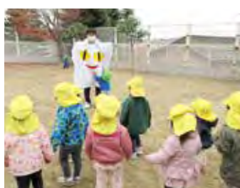
保育施設等における1歳児の受け入れを推進するなど、保育サービスの充実を図ります

新型コロナウイルス感染症との闘いが始まり2年。この間、医療関係者はもとより、市民の皆さまにご協力をいただいていることに深く感謝申し上げます。市民の皆さまの命と暮らしを守るため、市の総力を挙げて取り組んでいます。コロナ禍をはじめ、情報化の進展や気候変動問題、少子高齢化など、都市を取り巻く状況が急速に変化し、不確実性を増す中、いかにして心豊かな暮らしとまちの持続的発展を実現していくのか、今そのことが問われています。 基本計画の理念として掲げる「The Greenest City SENDAI」。震災から10年を経過する中、本市は世界を視野に、新たなまちづくりのステージへと向かう扉を開きました。東部沿岸エリアを新たな交流を促す拠点として進化させるとともに、青葉山エリアを本市のアイデンティティーを象徴する場所として磨き上げます。音楽ホールと中心部震災メモリアル拠点を複合化して