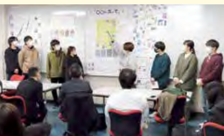
「たいはく若者まちづくりフォーラム」では、地域の魅力創出をテーマに大学との共同講座を開催

区民の皆さんと協働でまちづくりを進めます。「太白区民まつり」や小学生の体験学習事業、大学との協働により、若者のまちづくり活動への参加を支援する事業などを企画・開催します。また、公募により市民団体が実施するまちづくり活動への助成を行うなど、地域づくり活動を支援します。