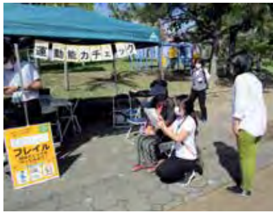
地域の公園等において、訪れた市民にフレイルのチェックや予防のための助言を行います

高齢者が地域で生き生きと暮らし続けられるよう、介護予防や生活支援サービスを提供することもに、介護予防活動の担い手づくりや活動の場づくりなどに取り組みます。また、フレイル状態になる可能性の高い高齢者を早期に発見するため、生活の場にリハビリテーション専門職等が出向く支援などを実施します。