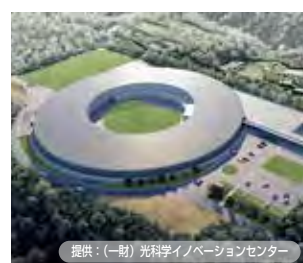
東北大学青葉山新キャンパス内に設置される次世代放射光施設（イメージ図）。令和6年度の本格稼働に向け、研究拠点や企業の立地促進等に取り組みます

青葉山交流広場に整備し、震災復興で私たちが支えた音楽の力と災害を乗り越える力を未来につなぐほか、スーパーシティ構想を推進し、投資を呼び込んでいきます。 未来に向けてまちが大きく動き出す今こそ、市民の皆さまが安心して大いに活躍できる環境づくりが重要です。さまざまな困難を抱える方々に支援を届けるとともに、一人一人が持てる力を十分に発揮できるように全力で応援します。 「笑顔咲く杜の都」の実現に向け、市民の皆さまとともに各般の施策を推し進めていきます。 世界に誇る魅力と活力を生み出すまちづくり