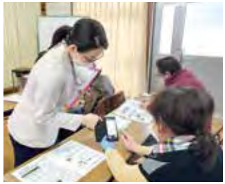
宮城地区西部の町内会に対する電子回覧システムの説明会

地域によって異なる課題に対応するため、職員が地域に赴いて町内会活動の支援などを行う「出前まちづくりサポートセンター」を運営します。さらに、地域団体やNPO、事業者など多様な主体が持つ力を生かし、マンシオン等のコミュニティ強化、学生の参加による地域づくり推進、作並・新川地区活性化、仙台萬本さくらプロジェクトなどの取り組みを支援します。また、ICTやAI等の先端技術を活用し、少子高齢化や人口減少が進む宮城地区西部（作並・新川地区、大倉地区）にお