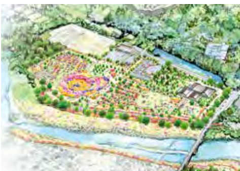
「全国都市緑化フェア」のメイン会場となる青葉山公園追廻地区のイメージ図

国内最大級の花と緑の祭典である全国都市緑化フェアの令和5年度の開催に向け、会場整備工事や植物調達、広報宣伝、会場運営等の事前準備などに取り組みます。