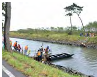
新浜町内会による「新浜フットパス」。貞山運河の魅力を感じながら船遊びや周辺散策などを行っています

2億1190万円 東部沿岸地域において、貞山運河の活用を含めた海浜エリアのにぎわいづくりに関する構想の策定に取り組みます。「新浜みんなの家」や「なかの伝承の丘」などの活用・発信への支援や、アーティストと地元住民等によるアート作品の制作など、東日本大震災の記憶の継承と発信を行うとともに、沿岸部各地区の魅力をつなぎ、にぎわいづくりを進めます。