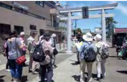
歴史を学びながら新しい魅力を発見する「若林わくドキまち歩き」

区民の皆さんと協働でまちづくりを進めます。「若林区民ふるさとまつり」や「若林わくドキまち歩き」など地域の特色を生かし、魅力を発信するイベント等を企画・開催します。また、地域の自治力向上や活性化を図るため、公募により市民団体が自発的に取り組むまちづくり活動への助成を行います。