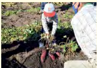
「さかいの地区創生会」によるサツマイモ収穫体験

多様な主体との連携により、各地域の活性化と地域力の向上に努めます。南部拠点地域（長町）のにぎわい創出や生田・坪沼地区の地域づくりを支援します。また、秋保地区では魅力ある体験観光や、空き家の利活用による交流人口の拡大および移住促進に取り組まします。