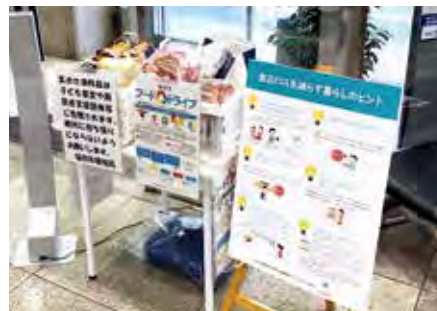
未利用食品をフードバンク団体等に寄付する「フードドライブ」を実施するなど、食品ロス削減に取り組みます

令和5年度からの製品プラスチックの一括回収・リサイクルに向けて、一部地域で先行実施します。リチウムイオン電池等の定日収集を開始するとともに拠点回収を強