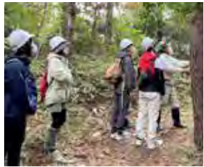
仙台青陵中等教育学校の敷地内にある「青陵の森」で開催された自然観察会

区民の皆さんと協働でまちづくりを進めます。「青葉区民まつり」、「宮城地区まつり」などを企画・開催するとともに、区民主体の各種イベントを支援します。また、地域の課題解決や活性化などに取り組みまちづくり活動への助成を行います。