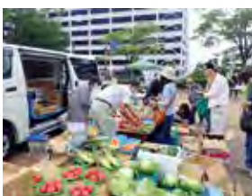
▲区民協働で実施している「いずみ朝市」。新鮮な野菜や果物などを求め、朝早くからたくさんの市民が訪れます

区民の皆さんと協働でまちづくりを進めます。「泉区民ふるさとまつり」や「七北田川クリーン運動」、「泉ヶ岳悠遊フェスティバル」などのイベントを開催します。また、地域と大学が連携して地域課題の解決を図る「いずみ絆プロジェクト支援事業」を行うほか、区民の皆さんが自主的に取り組むまちづくりへの助成を行います。