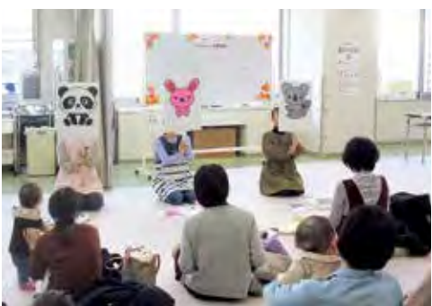
子どもの成長段階に応じた子育て相談会を開催するなど、切れ目のない支援を実施します

672億525万円 子ども医療費の助成について、令和5年度からの所得制限の撤廃に向けたシステム改修を進めます。先天性聴覚障害の早期発見・療育につなげるため、新生児を対象とした聴覚検査の費用を助成するほか、保育施設などにおける1歳児受け入れ枠を拡充します。また、産後ケア事業の対象となる母子を、