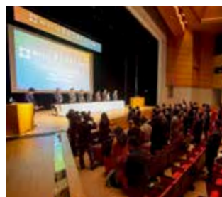
国内外の専門家等が集う世界防災フォーラム。防災・減災の取り組みを世界へ発信します（写真は令和元年開催時）

図ります。また、中小企業のオンラインを活用した販路開拓やテレワーク導入支援を進めます。 仙台・東北の多様な魅力を伝えるローカルツーリズムなどの取り組みを進めるとともに、コロナ後を見据え、台湾やタイへのプロモーションを強化します。また、G7関係閣僚会合の誘致を交流人口拡大につなげます。さらに、文化芸術の力をまちづくりに生かすため（仮称）仙台市文化芸術推進基本計画」の策定を開始します。 本市の良好な都市環境をアピールする好機となる全国都市緑化仙台フェアの開催準備を加速するとともに、世界防災フォーラムなどの国際会議を通して、本市の魅力国内外に発信します。 ゼロカーボンシティの実現に向けては、製品プラスチックの一括回収・リサイクルを、令和5年度からの全市展開に向けて一部地域において先行実施します。 ガス事業民営化について、エネルギー情勢の変化を捉えながら着実に取り組み、地域経済の活性化