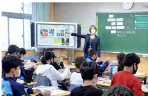
ICTを活用して、一人一人に合わせた学びを実現し、自ら考え、課題を解決できる力を育みます