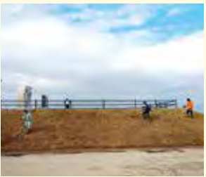
蒲生地区のかつての住民の皆さんによる、「なかの伝承の丘」の清掃活動

東部沿岸地域において、東日本大震災の記憶や経験を後世に伝えるとともに、豊かな自然などの魅力を発信しながら、海浜エリアのにぎわいを創出します。また、多様な主体の連携による地域づくり活動を支援するため、情報共有・課題検討を行う勉強会や、実践活動につながるワークショップの開催などをサポートします。