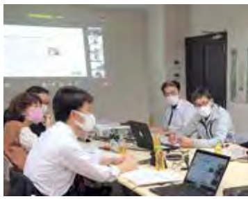
プロボノが仕事で培った能力を生かし、地域課題の解決をサポートします(写真は泉区住吉台地区で実施したモデル事業の様子)

コロナ禍で活動の制限を余儀なくされた町内会の活動再開を力強く後押しするため、「(仮称)町内会応援!プロジェクト」として加入促進に向けた啓発等を行います。また、地域課題の現状分析・調査や複数団体が協働で行う取り組みに対し助成を行うとともに、専門的なスキルをもった市民等「プロボノ」が地域課題の解決を後押しする取り組みなどを進めます。