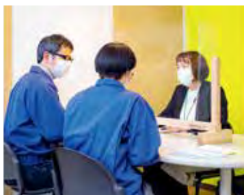
コロナ禍の影響を受けた中小企業を支援するため、資金繰りや販路開拓等の相談に応じる中小企業応援窓口を開設しています

「仙台市経済成長戦略2023」に基づき、地域経済の持続的発展に向けた取り組みを実施します。最先端技術を活用した未来都市構想であるスーパーシティなどの推進に向けて、産学官金の連携を進めるとともに、ICT産業の振興や地域企業のデジタル化等に取り組みます。また、新型コロナウイルス感染症の影響を受ける地元中小企業の販路開拓を支援するとともに、コロナ後の地域経済の活性化に向けて、中心部商店街・国分町の集客力向上につながる取り組みや、商店街等で買い回りを促進するキャンペーンを行います。