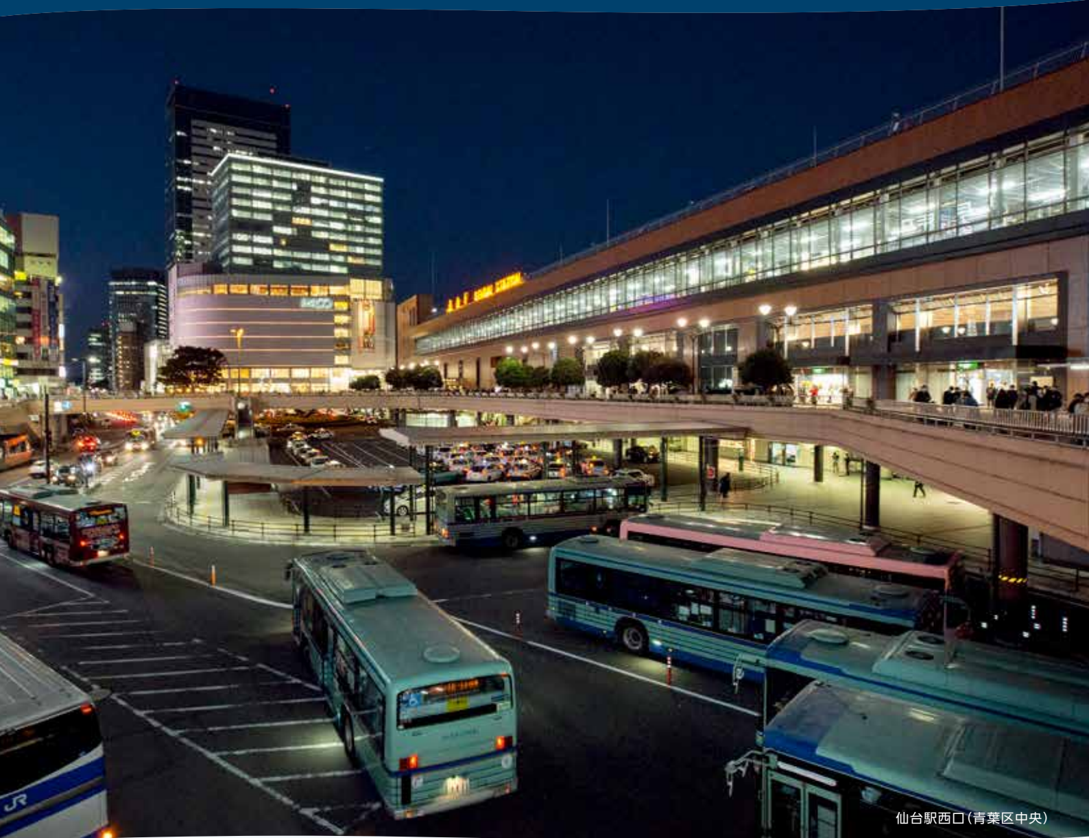
仙台駅西口(青葉区中央)