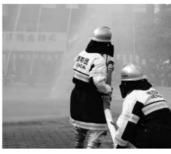
▲消防出初式での活動の様子

◆消防団員を募集しています 地域の安全・安心のために活動する消防団員を募集しています。 ●活動内容 火災や地震、水害等の災害が発生したときの人命救助や消火、避難誘導、防火指導など ●対象 市内にお住まいか通勤・通学している、心身ともに健康な18歳以上65歳未満の方 ●非常勤特別職の地方公務員として、年間の報酬や災害・訓練等の出場に伴う報酬の支給等があります ●入団の申し込み等について、詳しくは太白消防署にお問い合わせください ◆火災から身を守るための行動を コロナ禍で家で過ごす時間が増えている今、身の回りの防火対策を見直してみましょう。 住宅防火 命を守る10のポイント ●4つの習慣 ①寝たばこは絶対しない、させない ②ストーブの周りに燃えやすい物を置かない ③こまろを使うときは、火のそばを離れない ④コンセントは埃を清掃し、不必要なプラグは抜く ●6つの対策 ①ストーブやこまろは、安全装置付きの機器を使用 ②住宅用火災警報器を点検し、10年を目安に交換 ③寝具およびカーテンは 防災品を使用 ④初期消火のために、消火器を設置し使い方を確認 ⑤災害時の避難経路と避難方法を確認する ⑥防災訓練への参加など、地域ぐるみの対策を行う