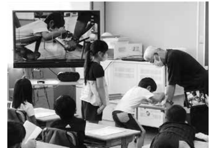
▲原町小学校で行われた出前授業では、児童がスズムシの生態などを熱心に学んでいました

スズムシが市の虫に制定されてから、本年度で50周年となります。仙台のスズムシは「七振り鳴く」と呼ばれ、かつて宮城野原に多く自生し、秋の夜長に美しい音色を奏でていたと言われています。しかし現在は、都市化の影響で、その鳴き声を聞くことが少なくなっています。宮城野区中央市民センターでは、地域団体「すずむしの里づくり実行委員会」と協働で、スズムシの音色が再び聞こえるま