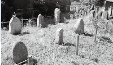
▲延命寺跡板碑群 (太白区柳生)

板碑とは、鎌倉時代から戦国時代にかけて作られた供養塔の一種です。石材を板状に加工した形から、板碑と呼ばれています。主に、亡くなった人が仏に導かれ浄土へ旅立つことを願って立てられました。板碑を造立する文化は、鎌倉時代の前半、