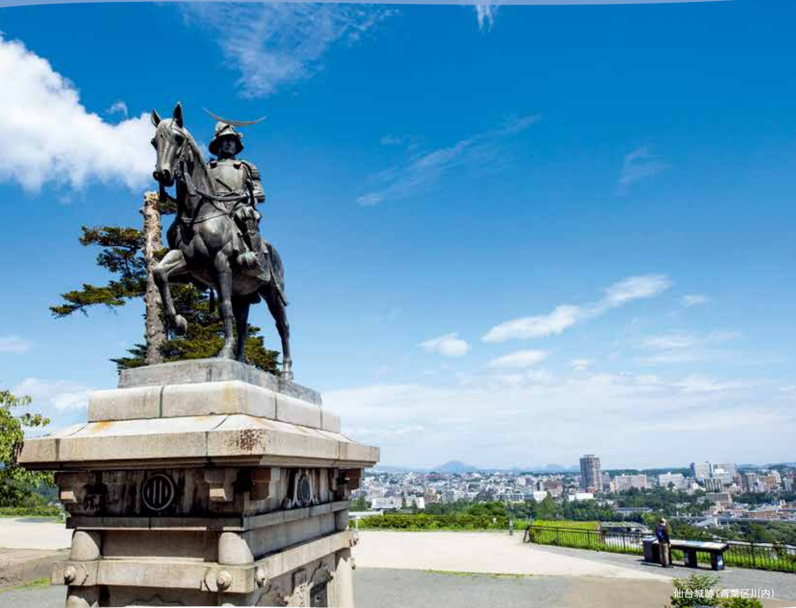
仙台城跡(青葉区川内)