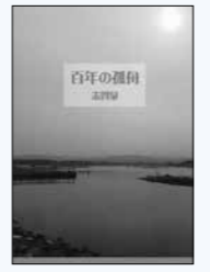
志賀泉 / 著 刊 荒蝦夷

東日本大震災を語り継ぐため市民図書館に設けた「3.11震災文庫」。所蔵する約1万冊からよりすぐりの本をご紹介します。 小説と短歌、真実を伝える〈言葉〉 荒蝦夷「仙台学」編集長 千葉 由香