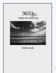
塔短歌会・東北 / 編 刊 荒蝦夷