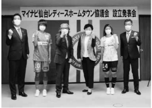
協議会設立発表会

9月から新たに開幕した女子プロサッカーリーグ「WEリーグ」に、東北から唯一参入するサッカークラブ「マイナビ仙台レディース」を支援するため、「マイナビ仙台レディースホームタウン協議会」が8月27日に発足しました。仙台市、宮城県、宮城県サッカー協会、仙台商工会議所等で構成されるこの協議会では、女子サッカーの普及を通じて、スポーツ振興や地域の活性化などを推進していきます。