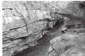
▲秋保石からなる磊々峡の岩壁

秋保石を作り出した噴火の直後、陥没した地域に雨水がたまり、「古仙台湖」と呼ばれる巨大なカルデラ湖が出来上がりしました。この湖の底でたまった地層からは植物の化石がたくさん産出しており、東北大学総合学術博物館にもそれらの化石が展示されています。また、この湖底でできた地層にはゼオライトと呼ばれる粘土鉱物が多く含まれ、愛子で採掘されるものはペットのトイレ砂や住宅内装の脱臭・乾燥材として利用されています。このように、磊々峡やそれを生み出した白沢カルデラは、現在の仙台の景観や建築物、私たちの生活とも深い関わりを持っていると言えるでしょう。