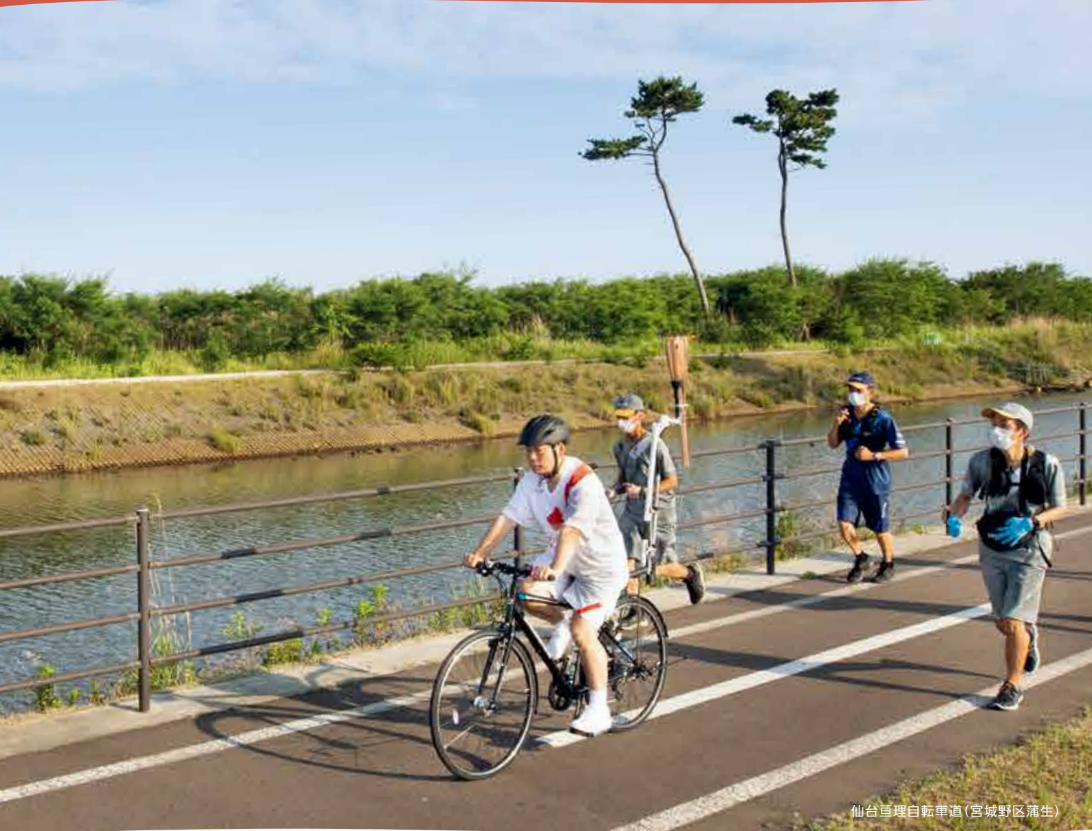
仙台亘理自転車道(宮城野区蒲生)