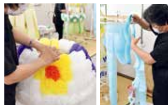
▲心を込めて一つ一つ手作業で七夕飾りを制作しています