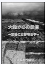
「宮城の災害を学ぶ―考古学』 考古学 考古学 考古学 考古学 考古学

震災から2カ月になろうとする平成23年5月初め、自転車を若林区の沿岸部へ走らせた。海岸線に沿って緑色の壁となっていた防潮林の木々は流され、多くの建物も失われるなど、津波によって風景は一変していた。仙台市の最も東南に位置する藤塚に行き着くと、かつて神社があった付近は一面の砂で、別世界だった。しかし、じっと目を凝らすと、砂の中に僅かに顔を出している石。夢中で砂を払うと、江戸時代の石碑だった。瞬間、映画「猿の惑星」の有名なラストシーン、自由の女神が砂丘に埋もれていた、あの映像が脳裏でオーバーラップした。少し目線を上げると、塩分が残っているはずの砂地に緑の芽生えが点在し、遠くには少ないながらも菜の花の黄色が。