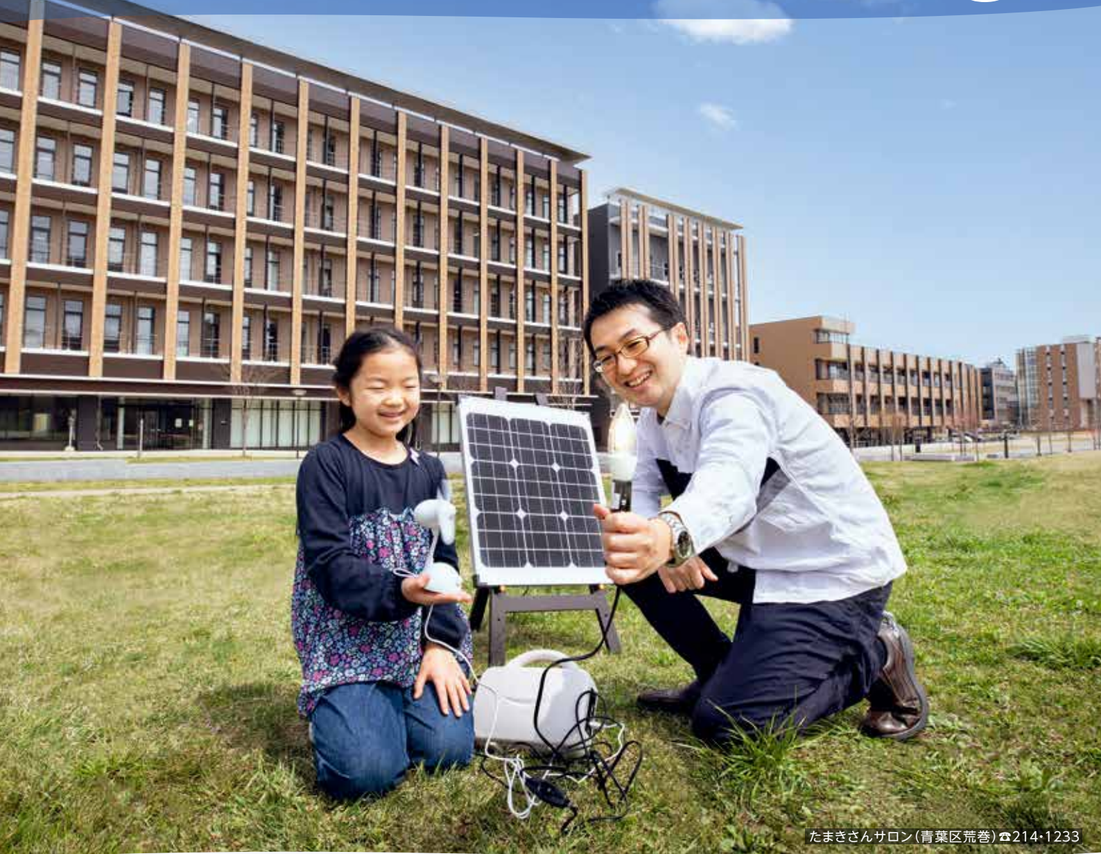
たまきさんサロン(青葉区荒巻) ☎214・1233

「せんだい環境学習館たまきさんサロン」では、サロン講座の開催や図書の貸し出し等を通して、暮らしと環境との関わりを楽しみながら学ぶことができます。(開館状況はお問い合わせください)