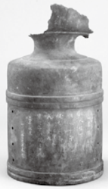
▲仙台橋 (大橋) の擬宝珠 仙台市博物館蔵

大橋を出発し、東に進むと、「大町」が見えます。ここは城に一番近い町人の町で、商売をする人々が住み、多くの人でにぎわっていました。大町を通る大町通り、城下で一番大きな道である奥州街道が交わる場所が芭蕉の辻で