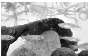
▲震災前に研究用に採取されていたため、絶滅を免れた井土メダカ。市内各地の里親に育てられてきました