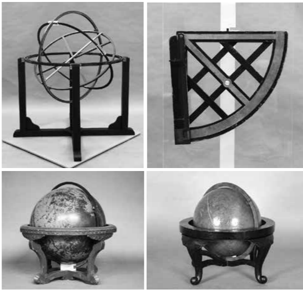
▲仙台市天文台で展示している渾天儀（左上）、象限儀（右上）、天球儀・大（左下）、天球儀・小（右下）

「仙台藩天文学器機」は、天体の位置を観測する渾天儀、天体の高度観測に用いる象限儀、天球を模型にして天体の観測値を記録す