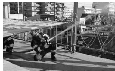
▲放水訓練の様子。ロープの結び方やホースの延ばし方などの一つ一つの動作を、現場を想定した強い緊張感を持って行っています