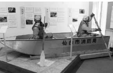
▲消防署の1階には、東日本大震災当時、ボートで救助に当たった隊員の様子を再現したパネルや、職員活動の記録が展示されています

空気がピンと張り詰めているような寒さ厳しい朝でも、号令を掛ける声が響く若林消防署。約50人の隊員が、日々火災や救急、災害時の救助等の訓練を行っています。新型コロナウイルスの感染拡大により、救急出動時にはシールドグラス(目を保護する眼鏡)や機密性の高いN95マスクを着用。出動ごとに救急車の車内消毒を行い、感染予防対策を徹底しています。コロナ禍の現場の最前線で、市民の安全・安心な暮らしを支えています。