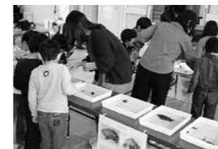
▲区内の児童館で行った地域の環境について考える出前授業