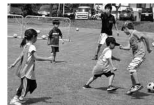
▲地域の子どもたちとの交流を図るサッカー教室