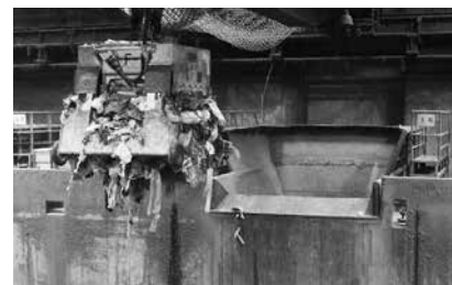
▲クレーンで約2.2トンのごみを持ち上げ、焼却炉投入口へ入れます。ごみの乾燥状態などに応じて投入量を調整します

今泉工場は昭和60年に竣工したごみ処理工場です。1日当たり150~200台の収集車が入ってくるほか、平日は300台以上の自己搬入もあり、1日約300トンのごみ焼却処理を24時間体制で行っています。焼却炉の熱により発生した蒸気を使って発電もしており、工場やリサイクルプラザなど周辺施設の電気を賄うだけではなく、電気を売って収入源にもなっています。この蒸気は、隣接する今泉運動場の暖房や温水プールの水を温めるのにも使われています。