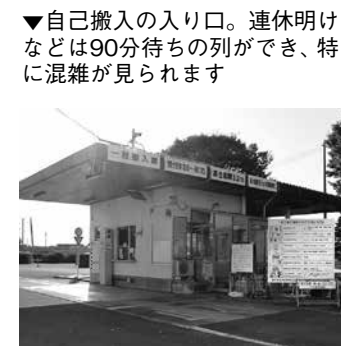
▼自己搬入の入り口。連休明けなどは90分待ちの列ができ、特に混雑が見られます