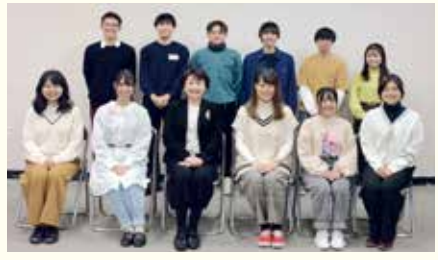
※撮影のため、マスクを外しています

今回の成人式は、制約が多く苦労さ れているのではと思っていました。が、 「二生に一度のイベントに企画する側 として参加したい」「いろいろなアイデ アが出ているので、思い出に残る式に なるよう頑張 りたい」など 意欲的に取り 組む姿が本当 にまぶしく感 じました。成 人式が無事に 開催されるこ とを願って、 「けやきなみ き」を実践し ましょう!