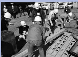
▲町内会での防災訓練

市では、昭和53年の宮城県沖地震を教訓に、町内会を単位として、自主防災組織の結成を促進。防災資機材の備蓄・点検や防災訓練などの活動を行っており、結成率は99%と非常に高くなっています。互いに助け合う関係の大切さが見直されている今、町内会や自主防災組織など地域コミュニティの役割に大きな期待が寄せられています。