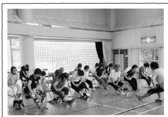
地域で行う健康体操会は、住民同士の交流を深める機会にもなっています

まず一つ目が、「みんなの居場所づくり」。誰でも自由に参加できる憩いの場「結いカフェ」を週2回、認知症の方やご家族が参加できる「めいめいカフェ」を月1回開催しています。二つ目が「見守り・安否確認活動」。1人暮らしの高齢者が孤立しないように、各町内会や民生委員児童委員等で見守りのネットワークを構築しています。三つ目が「助け合い活動」。ごみ出しや買い物代行など、家事支援や通院の手助けが必要な高齢者がいれば、お手伝いできる人をコーディネートしています。そして四つ目が「健康体操会」。高齢になっても自分のことは自分でできるように、ずっと元気であることが肝心です。そのために理学療法士監修の体操教室を実施しています。