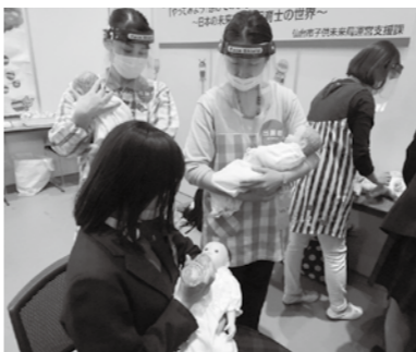
▲保育士業務の体験ブースでは、授乳やおむつ交換などの体験が行われました

高校生が地元企業等の仕事を体験するイベント「進路のミカタLIVE! 未来ビュー仙台」が10月30日に夢メッセみやぎで開催されました。このイベントは、体験を通して、高校生に地元企業等の魅力や、学校での勉強と仕事の関連性を伝え、将来的な地元での就職やUターンにつながるものです。当日は、県内の高校生1642