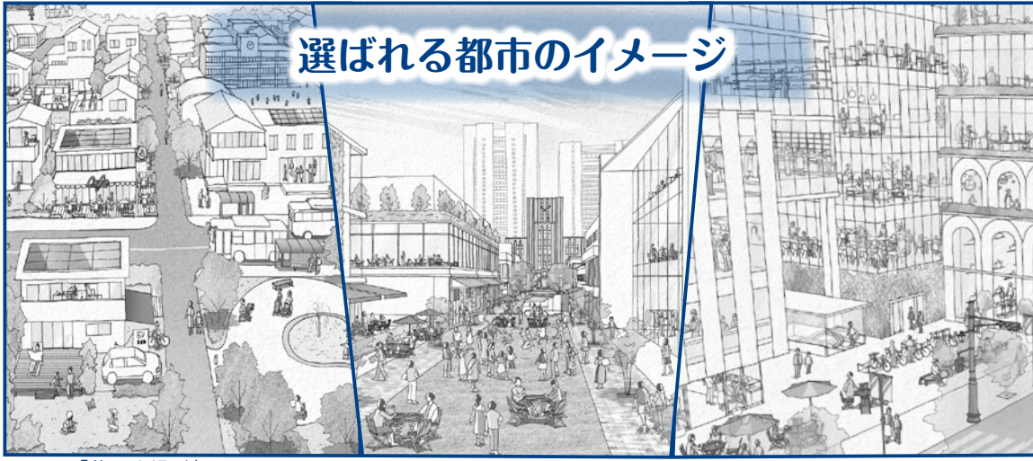
「暮らす場所」として 選ばれる都市