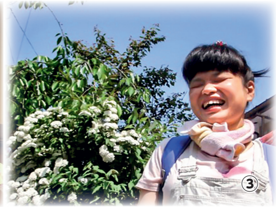
▲障害者グループホーム「さくらはうす①」「ひこくき雲②」「ひかりはうす③」の皆さんと職員の方々