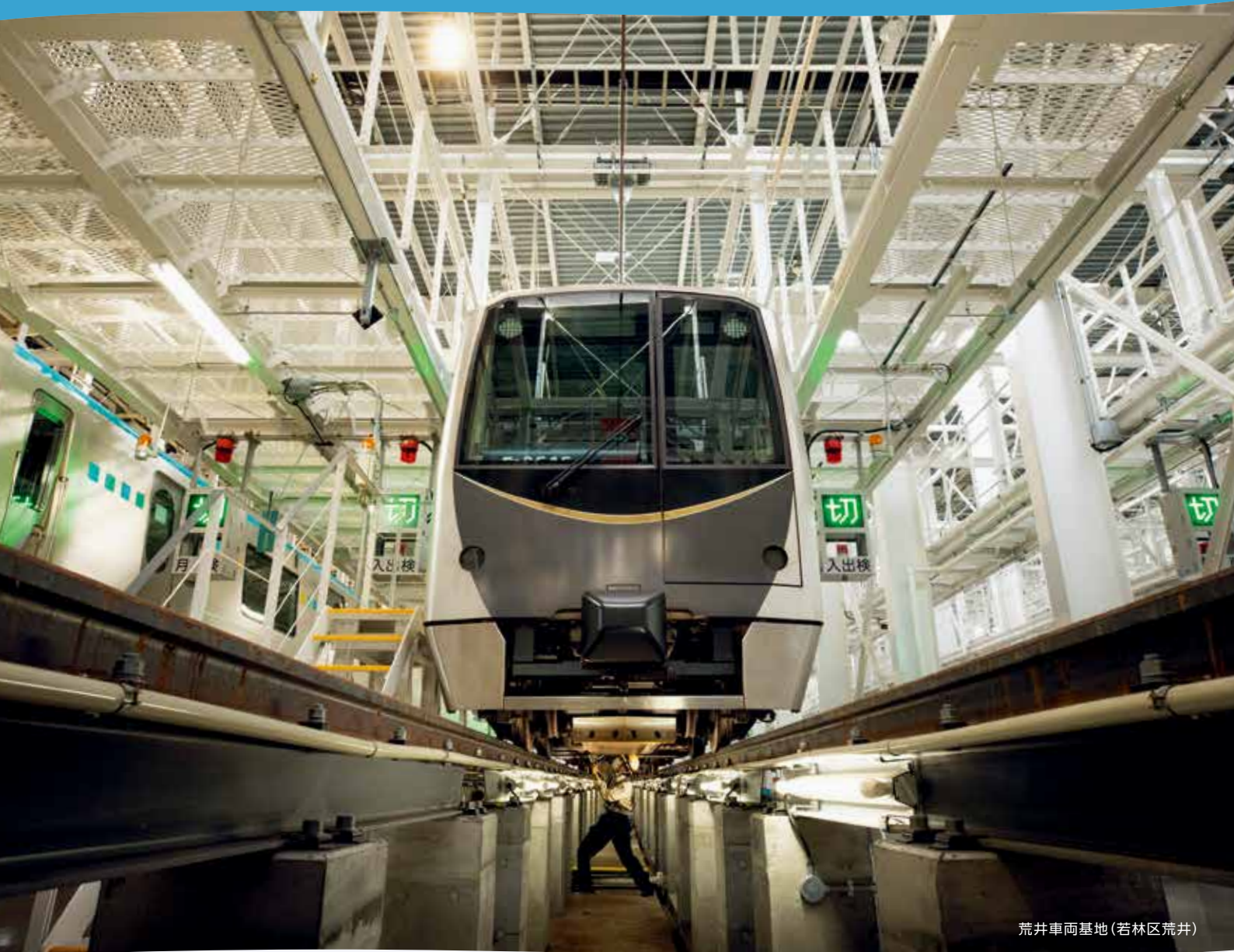
荒井車両基地(若林区荒井)