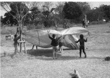
▲風が強い日には、シートで風をつかまえる遊びをしたり、広い芝生エリアでたこ揚げなどを楽しんでいる人もいます

東部復興道路(かさ上げ道路)の東側に接する海岸公園冒険広場には、子どもたち自身がやりたいことを見つけて自由に遊べる冒険遊び場エリアがあります。エリアを囲む遊歩道ではチョークで思い思いに絵を描いたり、ドングリや松ぼっくりを拾ってコマや飾りを作ったりするなど、自由な発想で工夫して遊べます。子どもたちを見守り、気軽に遊び方などの相談に乗ってくれるプレーリーダーも常駐しています。