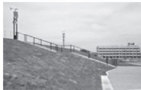
▲階段やスロープにより頂上部まで駆け上げられる避難の丘。奥に見えるのは、震災遺構仙台市立荒浜小学校

5月27日、若林区荒浜地区の防災集団移転跡地に避難の丘が完成しました。 この避難の丘は、震災遺構仙台市立荒浜小学校の南側に位置し、津波発生時には荒浜地区を訪れた人の緊急避難場所になります。標高10メートル、頂上部は正方形で面積約5700平方メートルと市内にある5つの避難の丘の中では最大規模。東西南北に1カ所ずつの階段と、海側から頂上部につながるスロープが設置され、5300人が避難可能となります。 避難の丘が整備されたことにより、多くの人が安心して荒浜地区を訪れ、新たなにぎわいや交流の創出につながることを目指します。