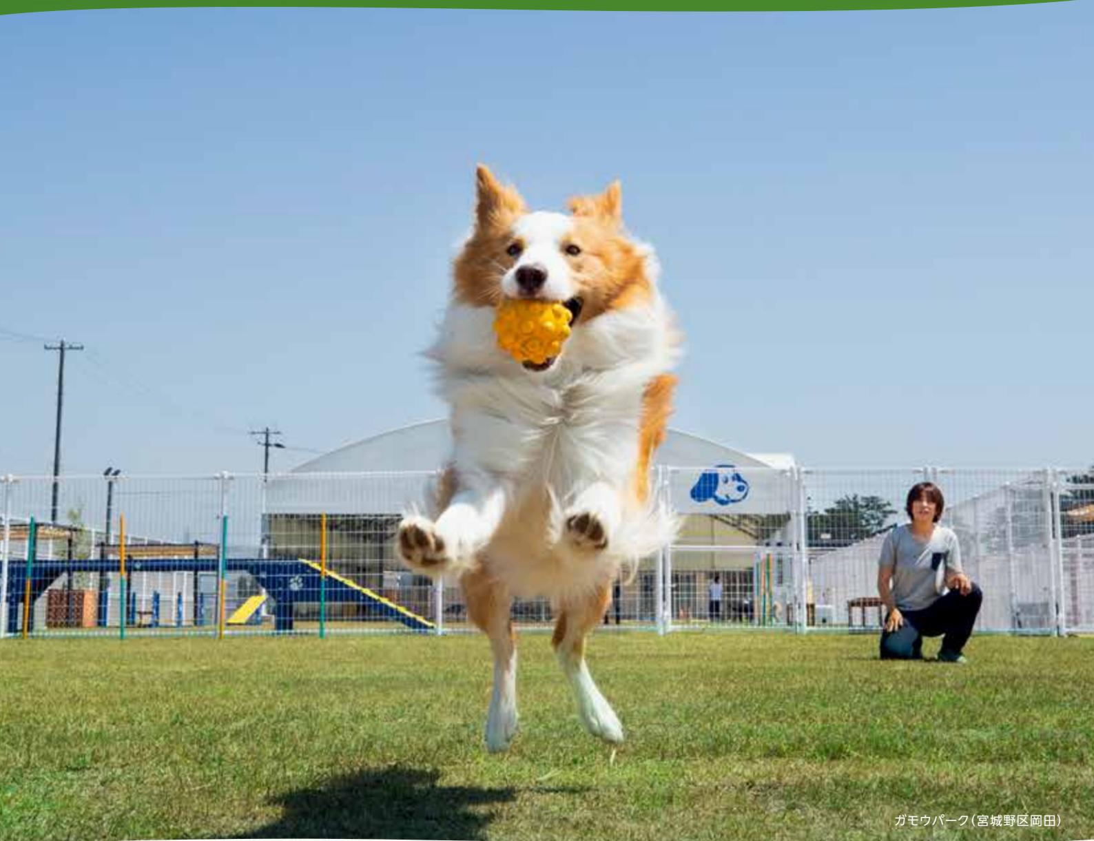
ガモウパーク(宮城野区岡田)

南蒲生地区の防災集団移転跡地に6月にオープンしたドッグラン。東北最大級の全天候型ドッグランやドッグプールを備え、笑顔あふれる新たな交流の場になっています。