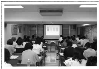
市民を対象としたセミナーなどを通して、身近な心の支援について知ることが大切です

A まず二つ目に、行政と民間の協働が不可欠になってくると思います。行政の組織でいえば、危機管理や福祉・子ども部門、教育委員会など。民間では、医療や心理・福祉領域、市民ボランティア