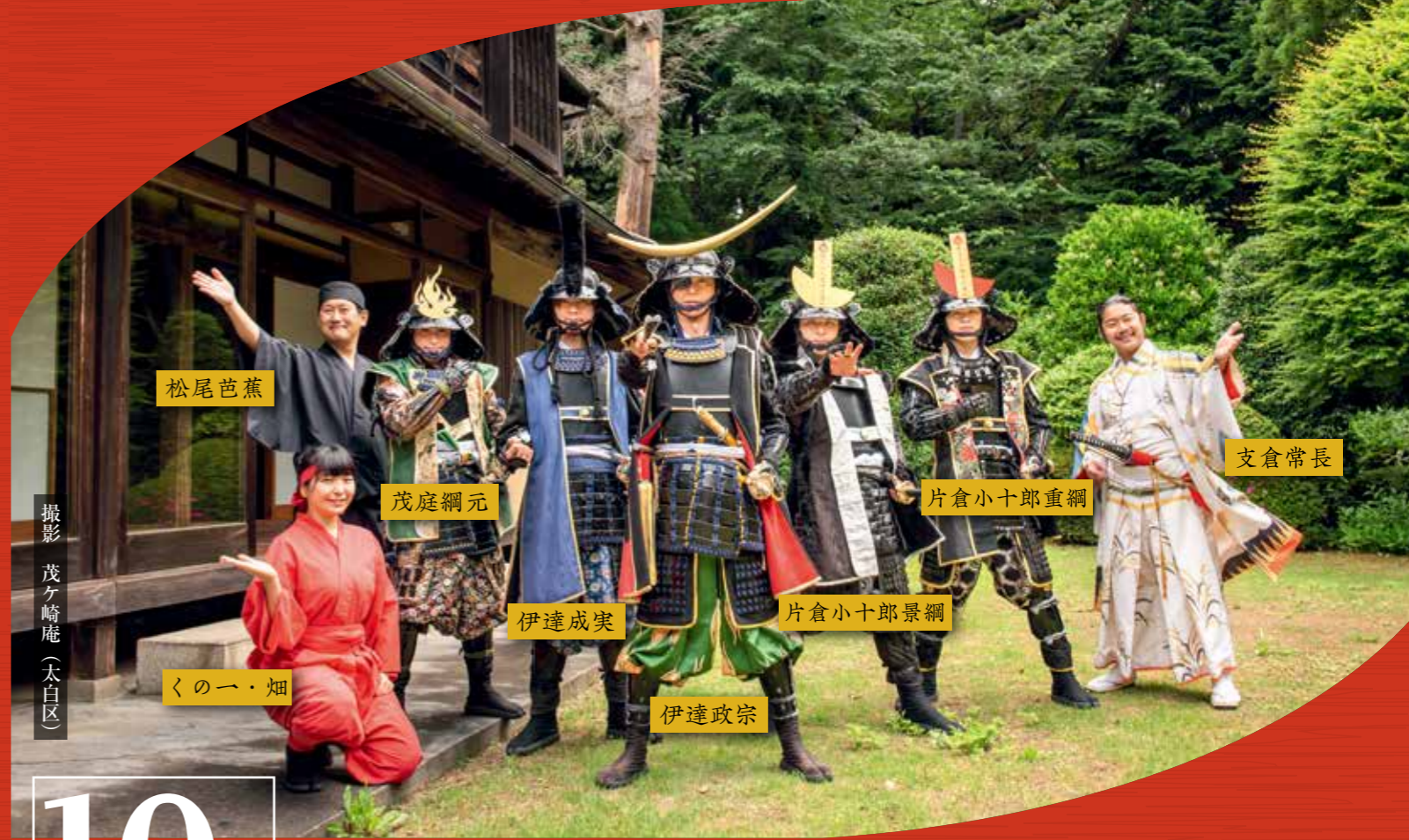
撮影 茂ヶ崎庵(太白区)

この特集に関するお問い合わせは観光課 ☎214・3018、FAX214・8316