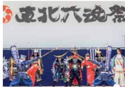
▲東日本大震災の鎮魂と復興を願い、東北6県の夏祭りを一堂に集めた東北六魂祭

常長 震災後、演武の最後に必ず「皆とともに、前へ 仙台・宮城」という言葉を入れるようになりました。演武自体にも、メンバー全員の復興への思いが込められています。これからの、被災された方の心に寄り添う気持ちを忘れることなく、活動していきたいです。 政宗公 10年はわしらにとってはまだまだ道の途中。仙台七夕まつりのような何十年、何百年と続く行事のように、伊達武将隊の存在が仙台の皆にとって当たり前とな