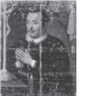
▲ユネスコ記憶遺産・国宝「慶長遣欧使節関係資料」支倉常長像 仙台市博物館蔵