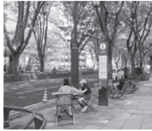
▲週末に訪れた人たちは初夏の風を感じながら読書や食事を楽しんでいました

市では、町内会やまちづくり団体等で構成される「定禅寺通活性化検討会」と共に定禅寺通の魅力向上に向けた取り組みを進めています。6月15日から、立町エリアの沿道地権者やテナント有志による社会実験「LIVING STREET PROJECT」を実施しています。 この取り組みは、定禅寺通の西側エリアの歩道にテーブルと椅子を設置し、歩道空間を利用したコミュニティの場を創り出すもので、昨年度に続き、行っています。今回は、椅子の数を減らして対面