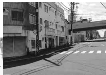
◀泰心院の山門は勾当台にあった藩校養賢堂の正門を移築したもので、市の有形文化財に指定されています