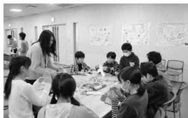
▲昨年度の活動の様子

●活動内容に応じて実費負担有り 申各小学校で配布する申込用紙またははがき、ファクスに住所・氏名(フリガナ)・電話番号・学校名・学年を記入して5月22日(必着)までに(直接窓口への持参も可。はがきまたはファクスの場合は「たいはくっこくらぶ申し込み」と記入)