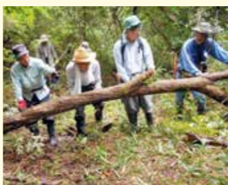
さかいの地区創生会による「旧板風道」の散策ルートの整備活動

ふるさと底力向上プロジェクト 生出・坪沼地区の活性化支援を引き続き行うほか、秋保地区の魅力ある体験型観光の創出や観光客と市民との交流促進など、