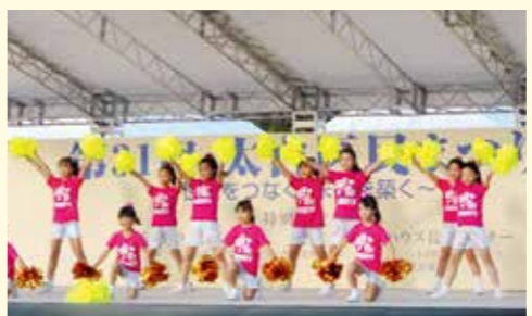
「太白区民まつり」では、さまざまな市民団体がステージ演出を行います

区民協働まちづくり事業 区民の皆さんと協働でまちづくりを進めます。「太白区民まつり」や小学生の体験学習事業、区内の自然・歴史を探究する事業などを企画・開催するほか、公募により、市民団体が実施するまちづくり活動への助成を行います。また、地域づくりの担い手同士の交流の機会を創出するなど、地域づくり活動を支援します。