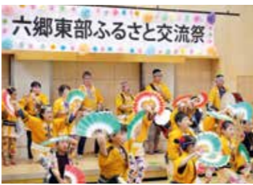
東六郷コミュニティ・センターで地域住民により開催されている「六郷東部ふるさと交流祭」

震災の伝承と発信 震災10年を迎えるに当たり、甚大な津波被害を受けた若林区において震災の記憶を伝承し、取り組みを発信することで、災害対応力の強化につなげます。被災者交流支援事業 復興公営住宅入居者等のコミュニティ運営支援や、被災者交流活動への公募による助成を行います。