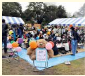
「みやぎのまつり」では、区民が主体となって工作体験、ブース展示等が催されます

区民協働まちづくり事業 区民の皆さんと協働でまちづくりを進めるため、「みやぎのまつり」などのイベント等を企画・開催します。また、子育て、防災、地域の魅力発信などの取り組みや、公募によるまちづくり活動への助成を行います。