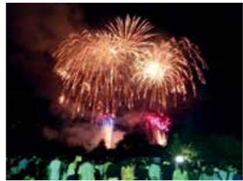
▼「泉区民ふるさとまつり」のファイナーレでは、花火が夜空を彩ります

区民協働まちづくり事業 区民の皆さんと協働でまちづくりを進めます。世代間交流を促進し、ふるさと意識を育てる「泉区民ふるさとまつり」、「七北田川クリーン運動」、「泉ヶ岳悠遊フェスティバル」等を開催します。また、地域と大学が連携して地域課題の解決を図る「いずみ絆プロジェクト」支援事業や「大学・地域連携による課題解決事業」を行うほか、地域の特色を生かし、区民の皆さんが自主的に取り組むまちづくり活動への助成を行います。