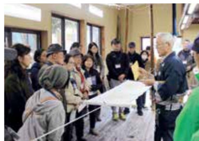
「若林わくドキまち歩き」では、地域の歴史や職人の技などを学びます

区民協働まちづくり事業 区民の皆さんと協働でまちづくりを進めます。「若林区民ふるさとまつり」、「合唱のつどい」、「若林わくドキまち歩き」など地域の資源や特色を生かしたイベント等を企画・開催します。また、公募により、市民団体が実施するまちづくり活動への助成を行います。