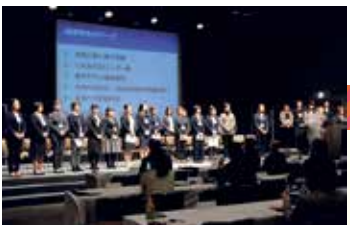
▲昨年12月に開催した修了式

個人で申し込むのではなく、企業が受講者を推薦し、研修に参加させること。受講者は、半年にわたり講義を受け、受講者同士でディスカッションを重ねながら、学んだことを職場で実践します。これまで117名が受講し、既に管理職として活躍する方もいます。