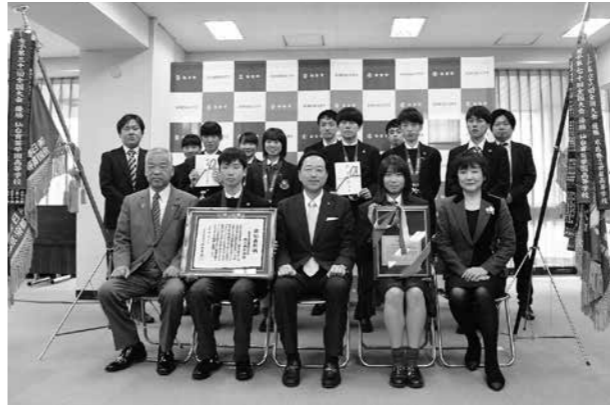
▲男女同時優勝を果たした仙台育英学園高等学校陸上競技部の皆さん

男子第70回、女子第31回全国高等学校駅伝競走大会において、仙台育英学園高等学校陸上競技部が、26年ぶり2回目の男女同時優勝を果たしました。2度の男女同時優勝は全国初の快挙であり、その功績をたたえ、1月30日、「賛辞の楯」を贈呈しました。賛辞の楯は、芸術、文化、スポーツなどの分野で優れた功績を残した市にゆかりのある個人や団体に贈るものです。市長は「大きなプレッシャーの中、仲間を信じ、たすきをつな