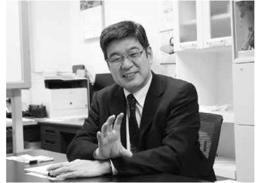
東北大学災害科学国際研究所 教授