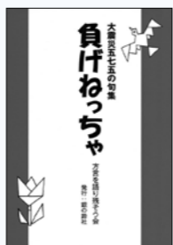
方言を語り残そう会／編 銀の鈴社 刊

東日本大震災から、もうすぐ丸9年が経とうとしています。物理的なものの復興は進んでいますが、心の復興についてはどうでしょうか。