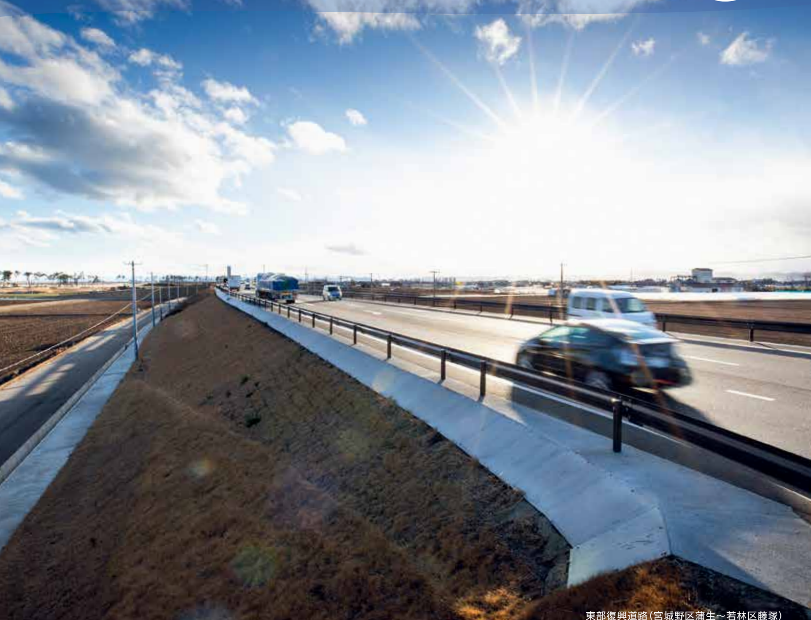
東部復興道路(宮城野区蒲生～若林区藤塚)

昨年11月に開通した東部復興道路。約6メートルかさ上げた道路は、堤防の機能を果たし、海岸堤防や防災林と合わせて、津波被害を軽減させる多重防御の要です。