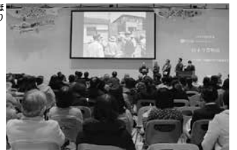
▲田子地域の風景・歴史等をまとめた冊子「田子今昔物語」作成に取り組む皆さんの発表

市民センターでは、子どもや若者、住民がそれぞれ主体となって地域の課題解決や地域資源の発掘をテーマとした学び合いや交流活動を行っています。その成果報告会が、1月19日にせんだいメディアアテークで開催されました。ステージでは、愛子地区を流れる住民に親しまれている川、千代老