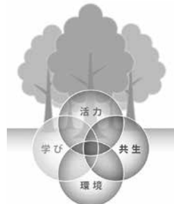
これまで仙台が培ってきた4つの都市個性をより強めていくことで、世界に誇れる「新しい杜の都」を目指します

まず1つ目が「環境」。歴史とともに育んできた豊かな自然環境を守り、その中で安心できる暮らしの実現を目標とします。また2つ目として、あらゆる価値観を尊重し合いながら「共生」できるまちに。さらに3つ目が、誰もが新しいことにチャレンジできる「学び」の機会の充実。そ