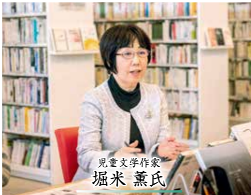
児童文学作家 堀米 薫氏