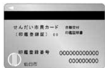
▲「印鑑登録証」と記載のあるカード