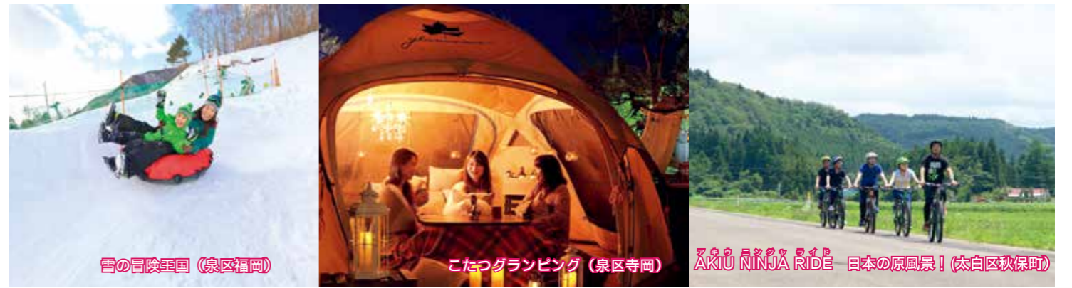
雪の冒険王国（泉区福岡）