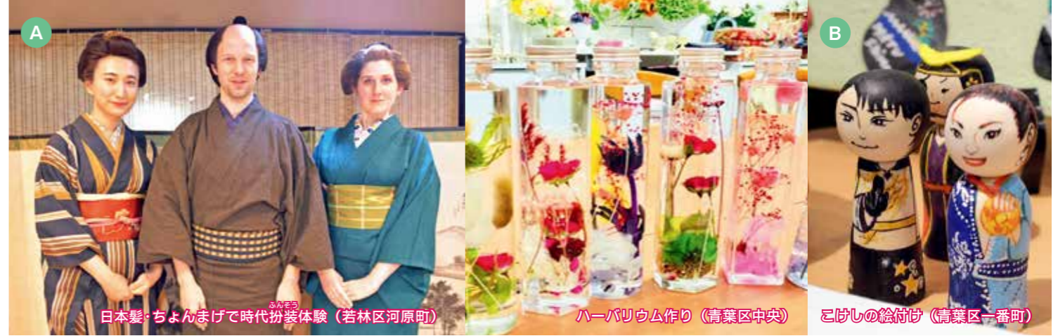
日本髪・ちょんまげで時代扮装体験（若林区河原町）