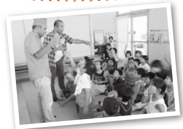
児童館での国際理解講座など、母国の文化や習慣を地域に伝える活動を行う

私が仙台に来たばかりのころ、「こんにちは」くらいしか日本語を知らずでした。最初は市民センターの日本語講座などで勉強し、それから趣味を通じて知り合った仲間とコミュニケーションを重ねるにつれて、少しずつ日本語を話せるように。その仲間から生活に役立つ情報も教えてもらいましたし、東日本大震災の時にもお世話になりました。