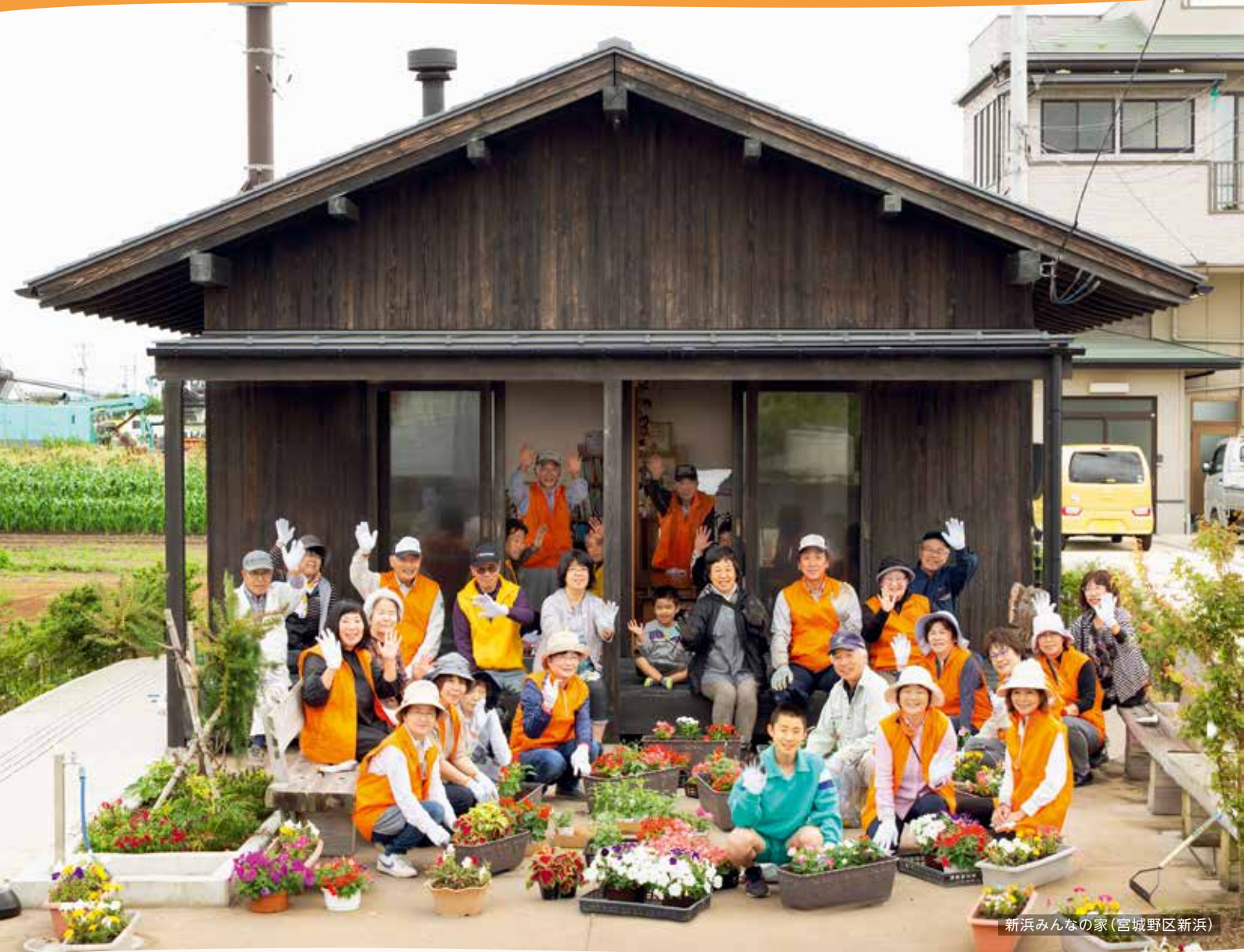
新浜みんなの家(宮城野区新浜)