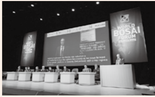
▲世界防災フォーラム/防災ダボス会議@仙台2017(平成29年開催)

目指す状況 世界に誇る防災力を持ち、豊かな自然を生かした快適で品格のある都市環境の構築および都市ブランドの確立