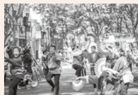
▲仙台・青葉まつり

目指す状況 東北の中核である仙台的都心において民間投資を呼び込む魅力的な都市機能を備えとともに、国内外から人が交流を求め集う、にぎわいや活力あふれる楽しめるまちの実現