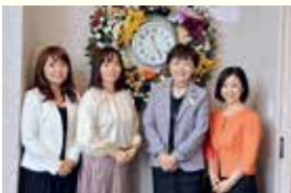
▲セミナーを始めた保護者のお話をきき始め、お話をきいた皆さまの自主勉強会も、お話をきいた皆さま

い」という「三方よし」に、働きやすい職場環境づくりの「働き手よし」を加えた「四方よし」な企業として、高く評価されました。