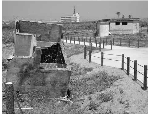
▲破壊された住宅跡。見学用の通路が設置され、津波の威力を間近で感じることができます。奥に見えるのは同じく震災遺構の荒浜小学校

公開記念式典には、市の関係者のほか、当時荒浜地区にお住まいであった方々も出席。震災遺構となった自宅跡を見つめながら、かつての懐かしい思い出を語り、地域の記憶が未来につながっていくことを祈っていました。