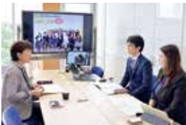
▲定禅寺通に面した明るいオフィスで、アップルの方々と懇談

完全個別指導による塾の運営や家庭 教師派遣を行うアップル。生徒一人一 人に向き合う指導を大切にし、また保 護者との対話を重ねる中で、不登校な 子どもたちを巡るさまざまな課題の 解決の一助になればと、子どもの自己 肯定感を育む保護者向けセミナーを取 り組んでいます。その参加者数は5千 人を超えているそう。こうした地域へ の貢献などが「売り手と買い手が満足 し、社会にも利益を生むのが良い商