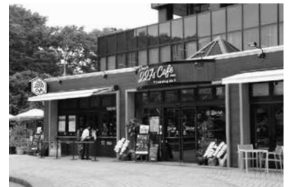
▲ずんだやいぶりがっこ等、東北の特産物を用いた、ご当地コッペパンのテイクアウトもできます(営業時間11:00~23:00)

食をはじめとした東北の魅力を発信するカフェ・レストラン「Route 227's Cafe」