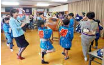
▲子どもたちも、振り付けをしっかり覚えて踊っていました