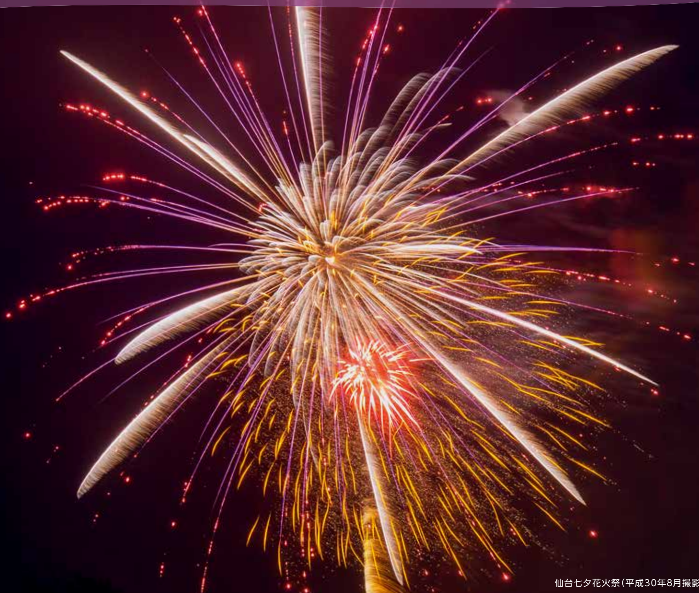
仙台七夕花火祭(平成30年8月撮影)