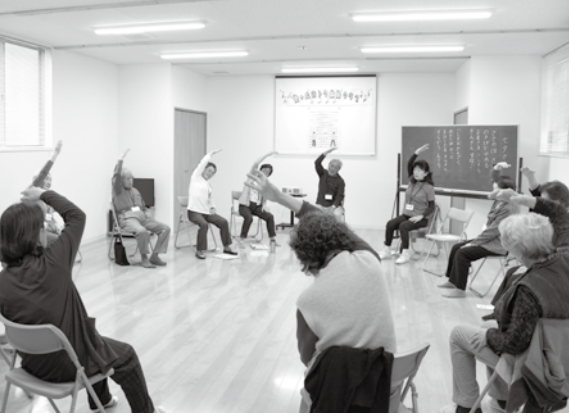
▲月2回、杜の都のおトク体操などに取り組む青葉区旭ヶ丘の介護予防自主グループ「おトク体操クラブ」

市では、気軽にできる運動「杜の都の体操シリーズ」を掲載したリーフレットを作成。ストレッチや筋力トレーニングからなる「杜の都のきほん体操」とテンポの良い。