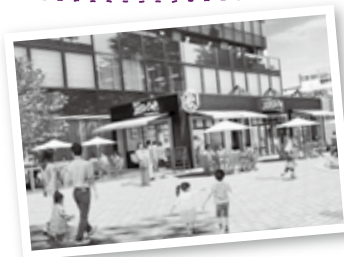
8月3日に勾当台公園内にオープンする「Route 227s' Cafe」は、東北の各市町村と連携しながら、東北の文化の発信拠点を目指します(9ページ参照)

これからもっと交流人口を拡大していくためには、仙台市が取り組もうとしているまちづくりなどの計画を確実に具現化し、都市の魅力を上げていくことが重要であり、周辺の市町村や東北各地との連携も強化し、重層的にPRしていくことが大切です。国内最大の観光地である東京を例に挙げると、東京への旅行者は都心にとどまることなく、周辺の鎌倉や横浜、伊豆・箱