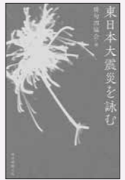
俳句四協会 編輯 朝日新聞出版 刊

本書は、後世への歴史的な遺産として、かつ俳人たちの今後の創作活動の礎となるべく、国内の4つの俳句協会が力を合わせて編んだものです。英語名は「ハイク・アンソロジー」。収められた1114人による2667句からは、震災後を生きるということ、言葉と生き直すこと、でもあることが伝わってきます。