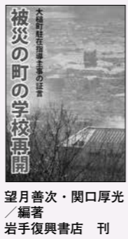
善次・関口厚光 望月善次 岩手復興書店 刊

東日本大震災の際、学校や教師たちの果たした役割は大きいものでした。多くの学校が避難所となり、住民たちの緊急事態の生活を支えました。ただ、広く冷えた体育館で、見知らぬ者同士がどうやって過ごすか、届いた救援物資をどう分けたいのか。日頃から児童や生徒集団を動かしている教師たちも、つノウハウが発揮されたのです。このことを学校や教師の視点からまとめたのが本書です。瓦礫の中から、最初に町に踏み出したのは子どもたちでした。学校が再開したからです。そして大人たちも復興への息吹をあげていきました。本書は岩手県大槌町の一女性指導主事(当時)からの聞き書きを基にまとめたものです。ここ仙台、宮城にも、同様に粉骨砕身した方々が多くいらっしゃいます。