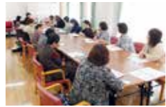
▲母親・父親教室。親としてできること等について一緒に考えます

ひきこもりで悩んでいる方や、家族からの相談をお受けします。本人や家族がのんびりくつろげるサロンや、母親・父親教室、社会復帰するための交流活動などを行っています。