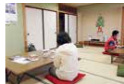
◀フリースペースでは、スタッフや他の参加者など、誰かのいる場所で自由に時間を過ごすことができます

心理士・保健師・精神保健福祉士などが、ひきこもりや心の健康に悩んでいる方からの相談をお受けします。個別相談のほか、ひきこもり状態の方のためのフリースペース、悩みを抱える家族同士の話し合いなども行っています。