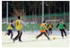
▲社会復帰のためのリハビリとしてスポーツなどの交流活動をしています