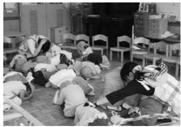
▲小さき花幼稚園でのシェイクアウト訓練。学校や保育所、企業などさまざまな場面で訓練が行われました

6月12日の「市民防災の日」に、仙台市総合防災訓練を行いました。自分の身を自分で守る「自助」の取り組みを確認するシェイクアウト訓練（身体保護訓練）には、約5万7千人が参加。午前9時に地震が発生したと想定し、参加者は家庭や学校などで「まず低く」「頭を守り」「動かない」という3つの行動を実践しました。また、当日は宮城県消防学校で、自衛隊や消防、災害時応援協定締結団体など20団体による実動訓練も実施。倒壊建物からの住民の救