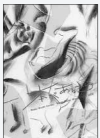
武田こうじ・前野久美子／著 Book! Book! Sendai 刊

「本があるから Book! Book! Book! Sendai! Book! Book! Book! Miyagi 2008—2018」