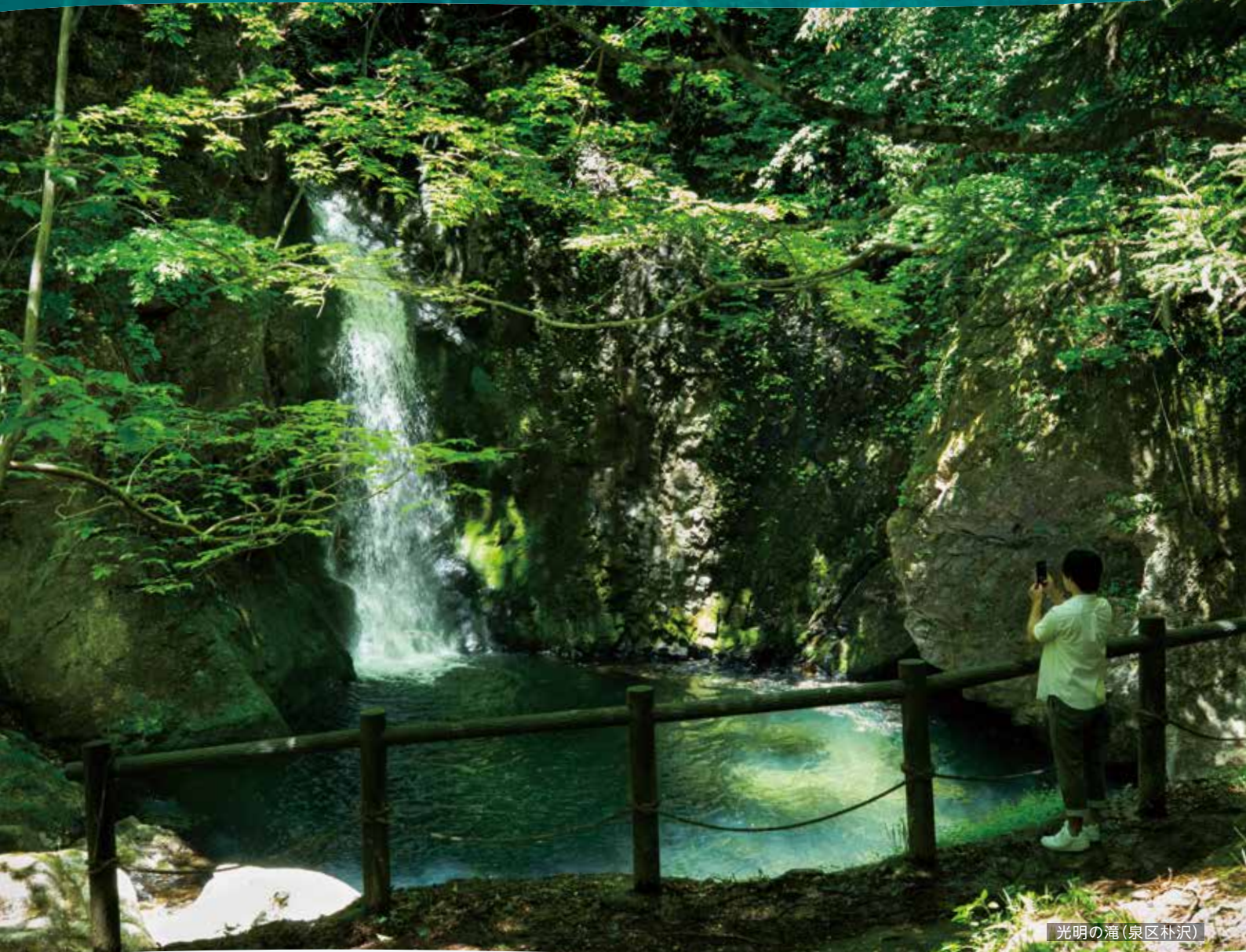
光明の滝(泉区朴沢)