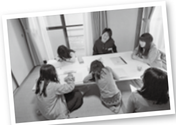
ご飯までの時間は学生ボランティアに宿題を見てもらったり遊んでもらったり。この学生たちが子どもたちの身近な目標にもなる

「おりざの食卓」を始めてから2年半で、利用者の延べ人数は3,000人超に。現在は週2回の開催で、3歳から80歳代までご利用いただいています。ここで大切にしているのは、家庭的な雰囲気。子どもたちは学校から帰ってくると、調理ボランティアさんがご飯を作る音や匂いを感じながら、学生ボランティアさんと一緒に宿題をします。また夕食後には会話の時間を設け、多世代で交流。こうした環境の中で、基本的な生活習慣や社会性も養ってほしいと願っています。実際に